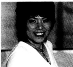
邓亚萍:华丽的转身

从无数个世界冠军的拥有者,到国际奥委会官员,到剑桥大学博士,到国家体育总局官员,再到今天的共青团北京市委副书记,这个个头矮小的体育明星似乎有无限的能量,她用自己的经历向世人证明了一切皆有可能。