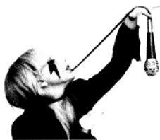
Lady Gaga:不走寻常路的时尚教主