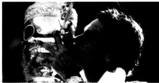
费德勒:丢掉坏脾气

2009年7月,一个名字令世界球迷疯狂——费德勒,他改写了历史。因为在温网公开赛结束后,他成为历史上获得大满贯最多的网球运动员。