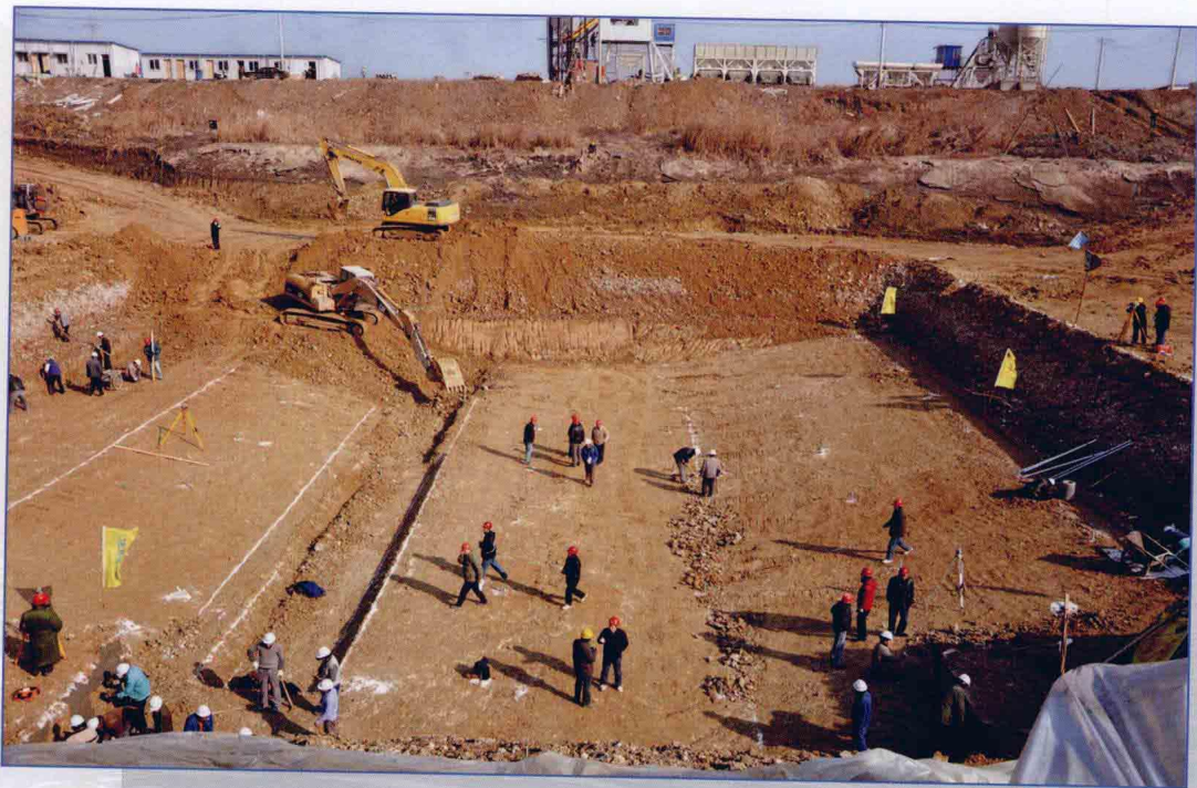
■ 2009年12月，南水北调东线一期工程刘老涧二站工程底板开挖现场。