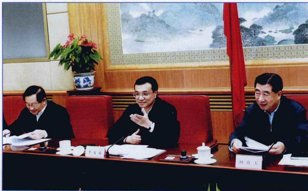
■ 2009年12月，国务院南水北调工程建设委员会第四次全体会议在北京召开，中共中央政治局常委、国务院副总理、国务院南水北调工程建设委员会主任李克强主持会议并讲话。中共中央政治局委员、国务院副总理、国务院南水北调工程建设委员会副主任回良玉出席会议。