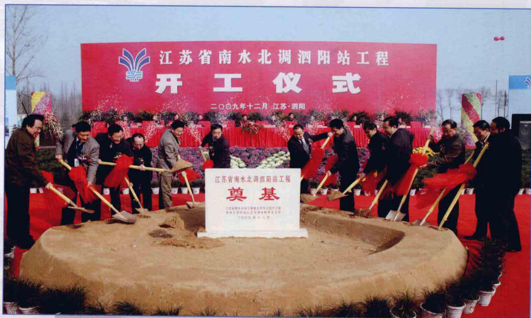
■ 2009年12月，南水北调东线一期工程泗阳站工程开工建设。