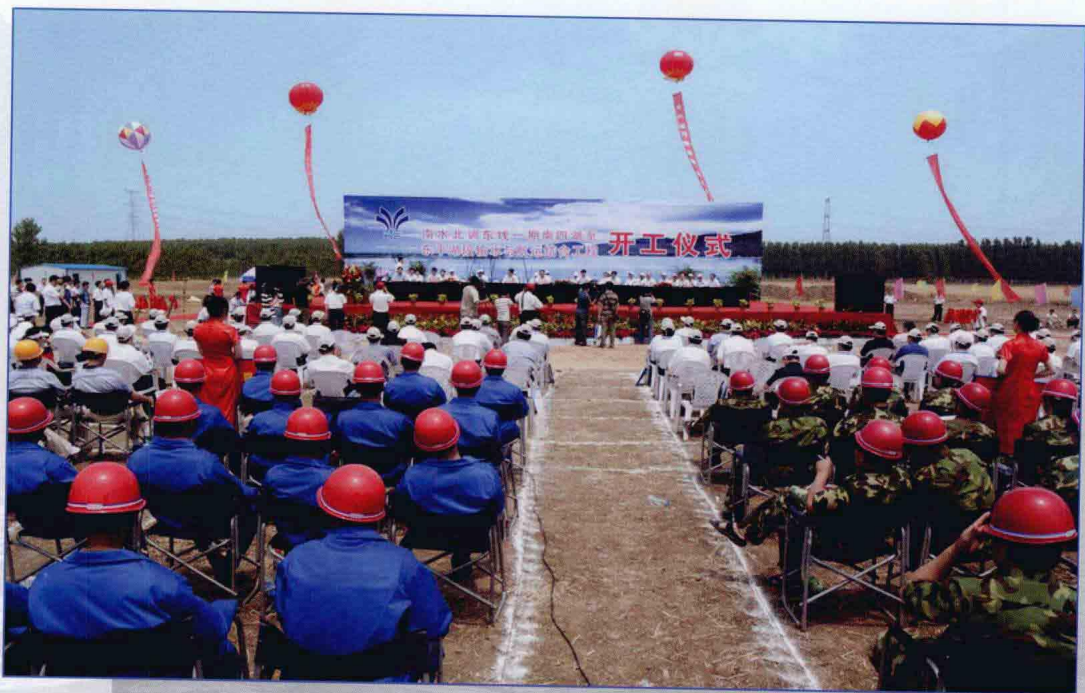
■ 2009年6月，南水北调东线一期工程南四湖—东平湖段输水与航运结合工程开工建设。