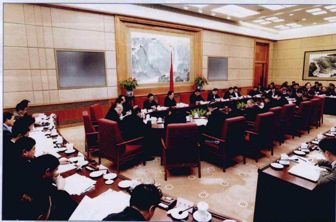
■ 2009年12月，国务院南水北调工程建设委员会第四次全体会议召开会场。