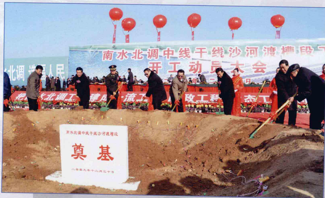
■ 2009年12月，南水北调中线一期工程沙河渡槽段工程开工建设。