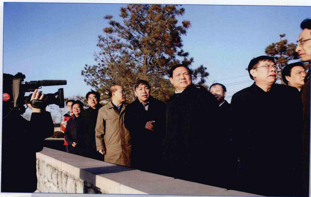
■ 2009年11月，中共中央政治局委员、北京市市委书记刘淇察看南水北调北京市内配套工程大宁调蓄水库工程。