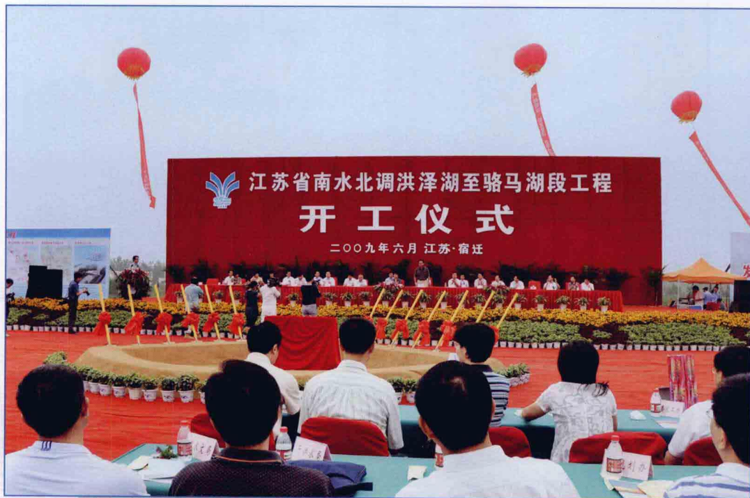
■ 2009年6月，南水北调东线一期工程洪泽湖—骆马湖段工程开工建设。