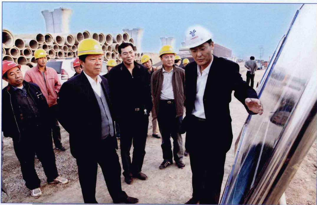
■ 2009年10月，国务院南水北调办副主任李津成考察南水北调中线一期工程天津干线工程天津市境内2段工程。