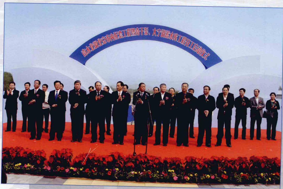
■ 2009年4月，南水北调北京市内配套工程暨南干渠、大宁调蓄水库工程开工建设。