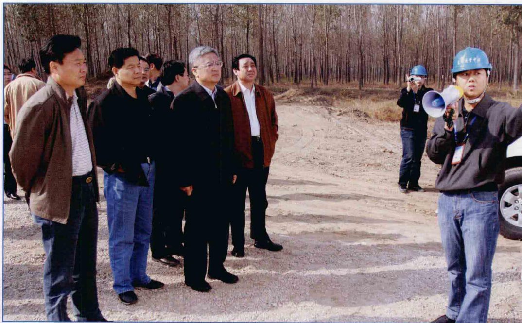
■ 2009年10月，中央扩大内需促进经济增长政策落实检查工作领导小组第二十三检查组检查南水北调中线一期工程天津干线工程天津市境内1段工程建设情况。