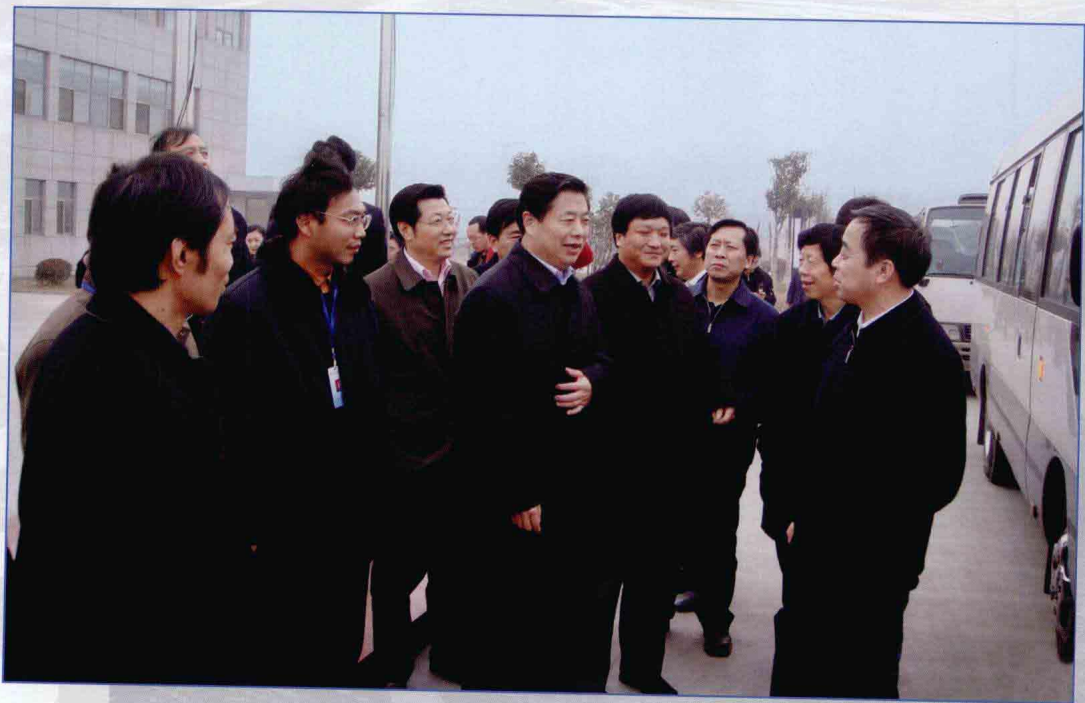
■ 2009年2月，水利部副部长鄂竟平考察南水北调东线一期工程解台站工程。