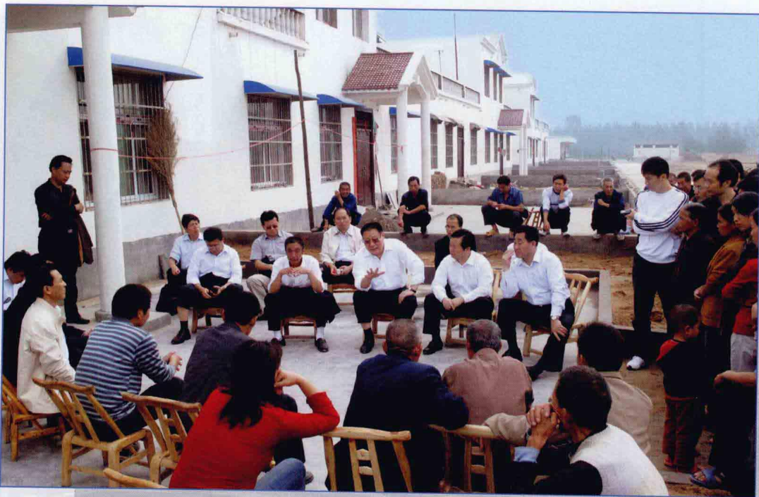
■ 2009年9月，国务院南水北调办主任张基尧考察南水北调中线丹江口库区移民试点原阳县狮子岗新村并与移民群众座谈。