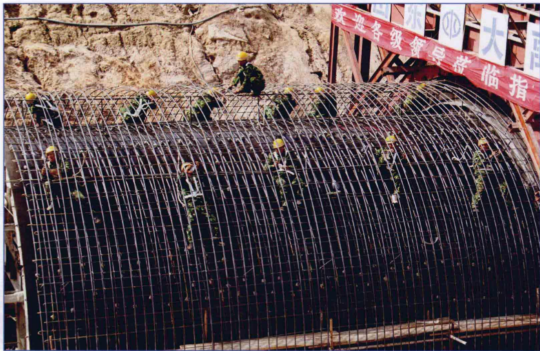
■ 2009年3月，南水北调东线一期工程穿黄河工程滩地埋管工程施工现场。