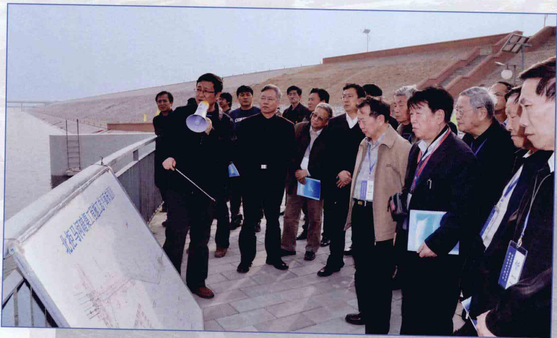
■ 2009年3月，国务院南水北调工程建设委员会专家委员会组织专家考察南水北调中线一期工程京石段应急供水工程。