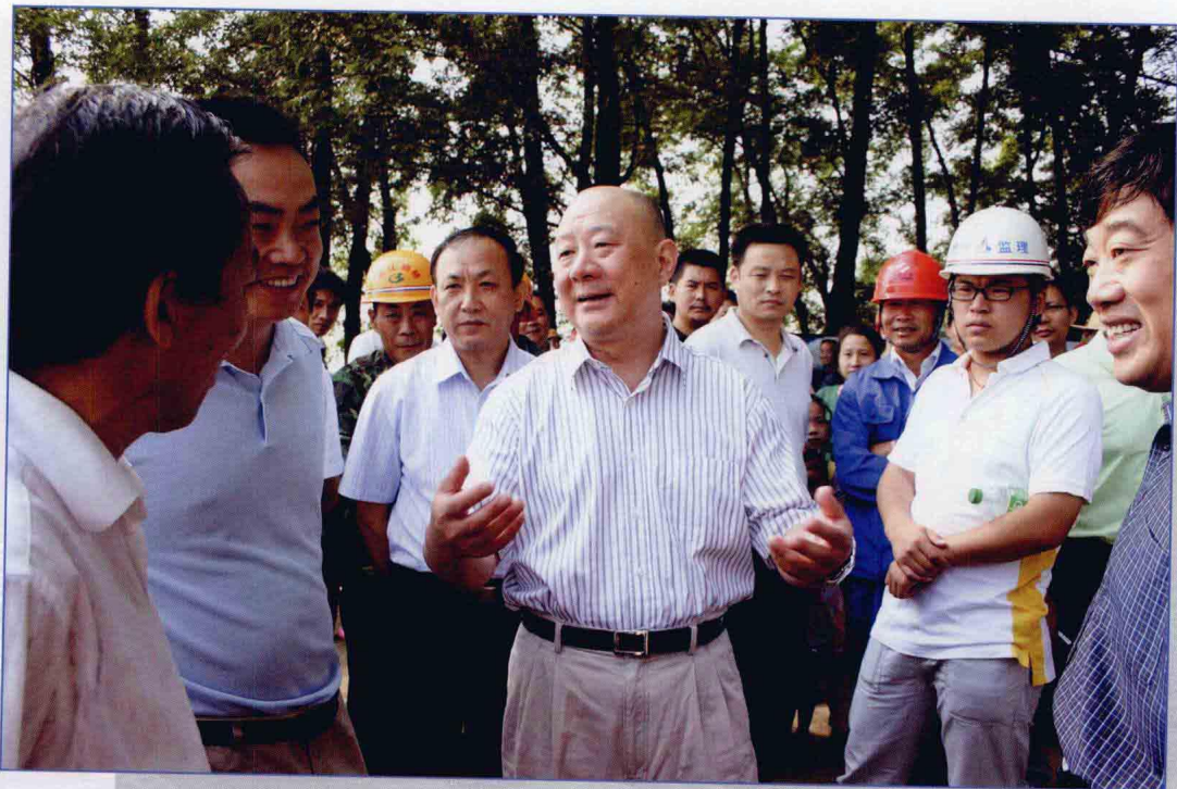
■ 2009年7月，湖北省副省长田承忠检查南水北调中线工程汉江兴隆水利枢纽工程建设情况。