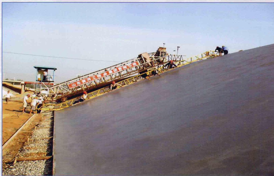
■ 2009年4月，南水北调东线一期工程穿黄河工程南干渠渠道衬砌工程施工现场。