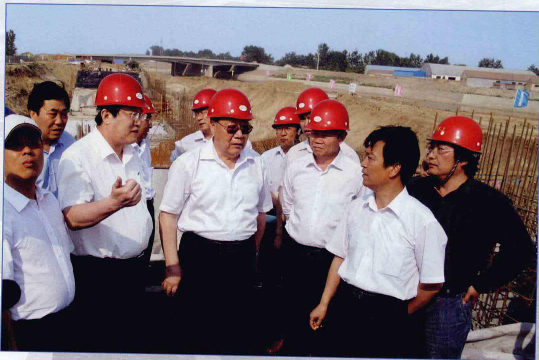
■ 2009年6月，国务院南水北调办主任张基尧在山东省副省长贾万志陪同下考察南水北调东线一期工程济南市区段工程。