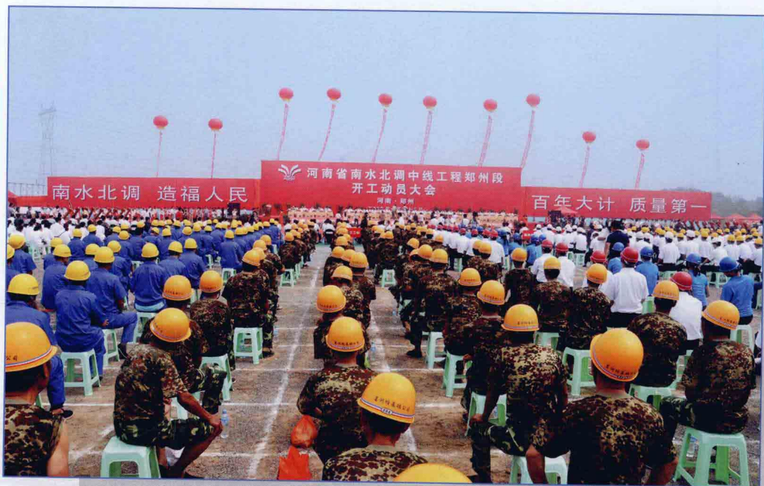
■ 2009年7月，南水北调中线一期工程郑州段工程开工建设。