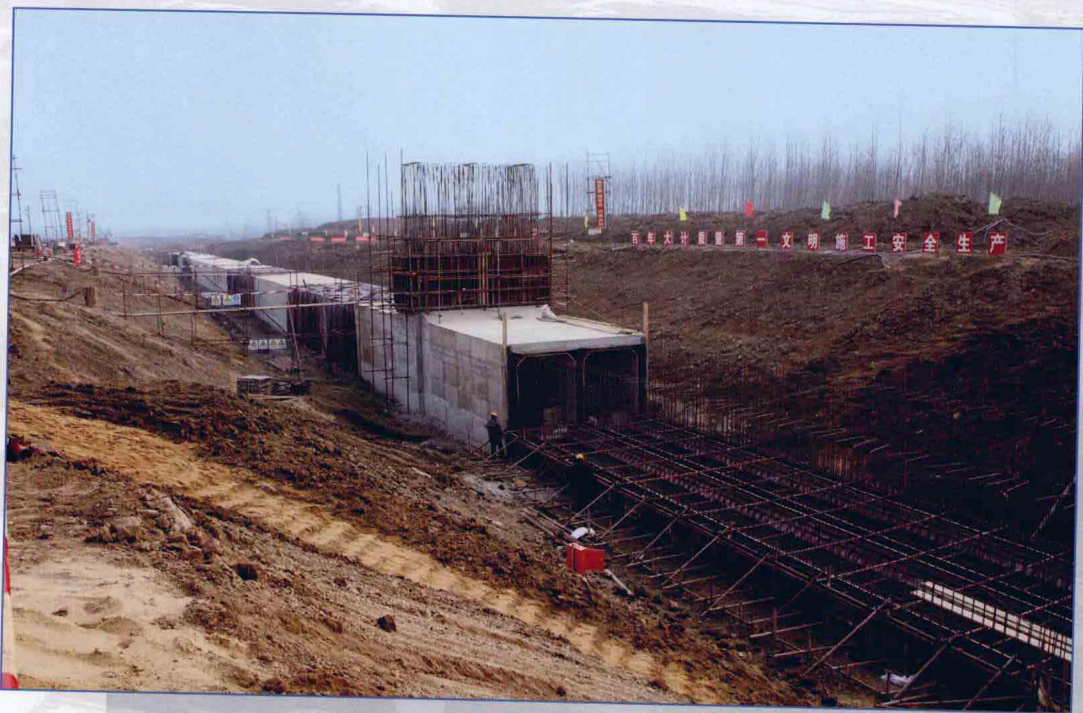
■ 2009年12月，南水北调东线一期工程徐州市截污导流工程张楼中运河地涵施工现场。