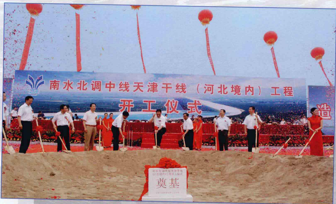
■ 2009年7月，南水北调中线一期工程天津干线（河北境内）工程开工建设。