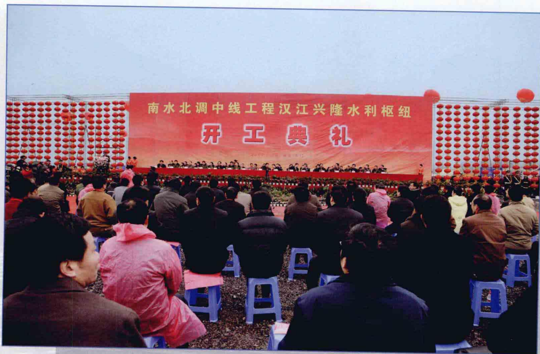
■ 2009年2月，南水北调中线工程汉江兴隆水利枢纽工程开工建设。