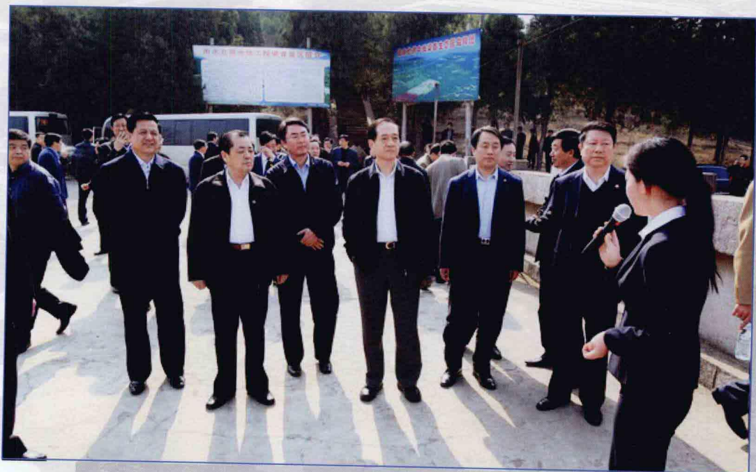
■ 2009年3月，全国人大常委会副委员长韩启德在河南省淅川县视察调研南水北调中线水源保护工作。