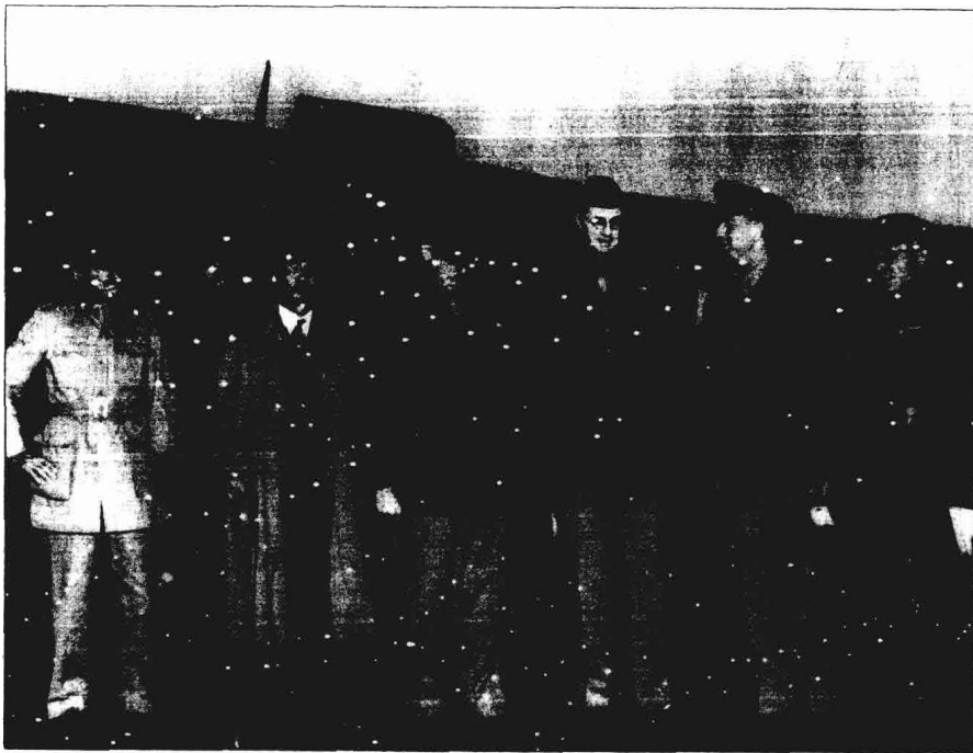
何應欽（右一）等中美將領在機場迎接魏德邁（右二）

多數船艦，剷除日本來往東南亞運輸的能力。日本陸軍確實還有一些運輸火車可以從西貢、經長沙到大連，但現在也沒用了。陳納德的空軍主宰了長江以南的空中優勢，他們對橋梁、鐵道之轟炸很快就使此一走廊喪失功用。