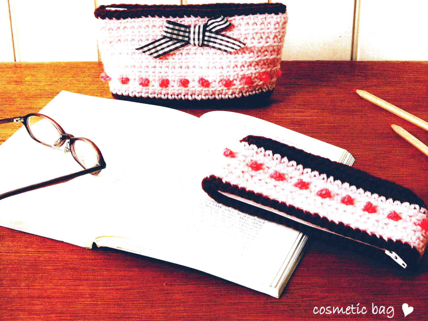
cosmetic bag ♡