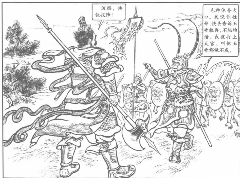
(16) 天兵天将来花果山。巨灵大将首先讨战。悟空得报，立刻披挂，手持金箍棒，带领众猴出阵迎敌。