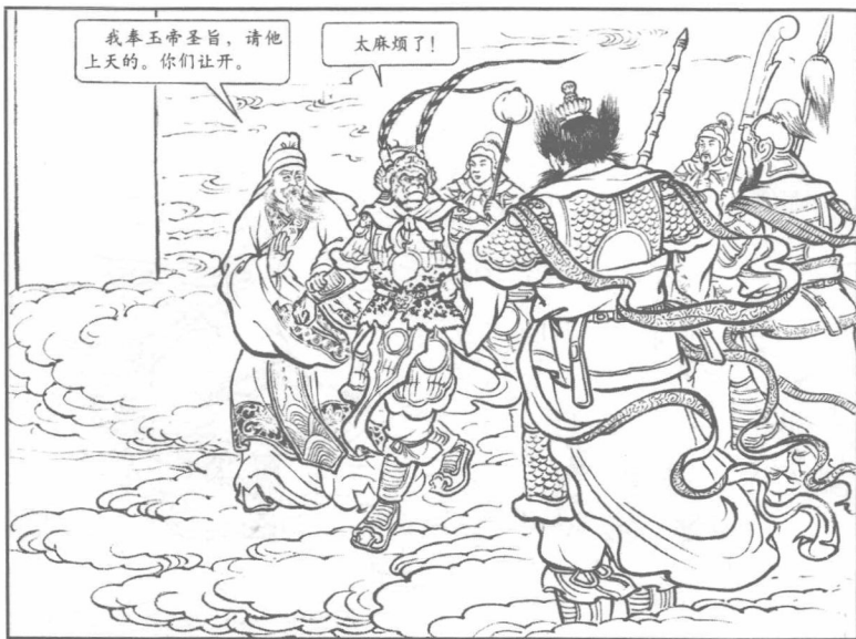
(7) 悟空正要动手，太白金星赶来劝住他，扯着他走进南天门。