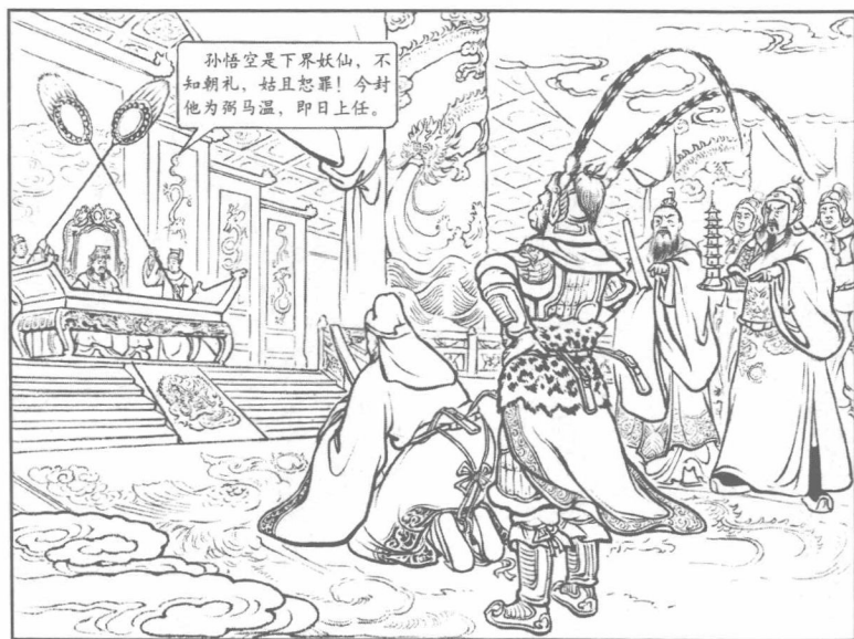
(8) 来到凌霄宝殿，太白金星上前跪拜缴旨，悟空却挺身站着；众仙官见他向玉帝参拜，都怒目相看。玉帝没有动气，封悟空做“弼马温”。