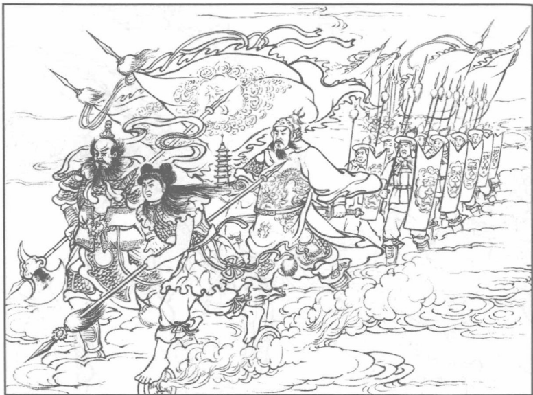
(15) 玉帝派了托塔李天王、哪吒三太子和巨灵大将带领天兵，下界去捉悟空。