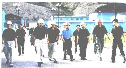
市旗两级领导共商矿业发展大计