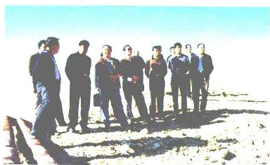
旗党政领导深入企业调研