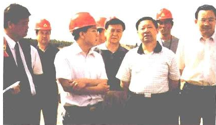
自治区党委书记储波视察矿山工业