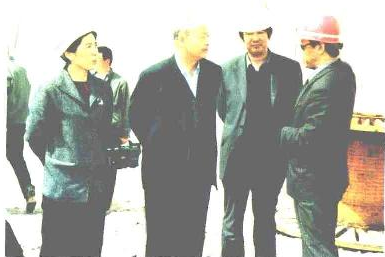
自治区党委副书记杨利民、政府副主席乌兰考察矿山工业