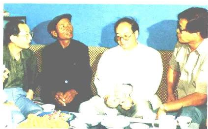
原卫生部部长陈敏章在牧区调研