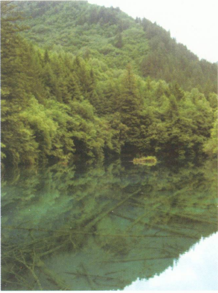
九寨溝山水風光 (湖水清澈見底，實景與倒影難分)