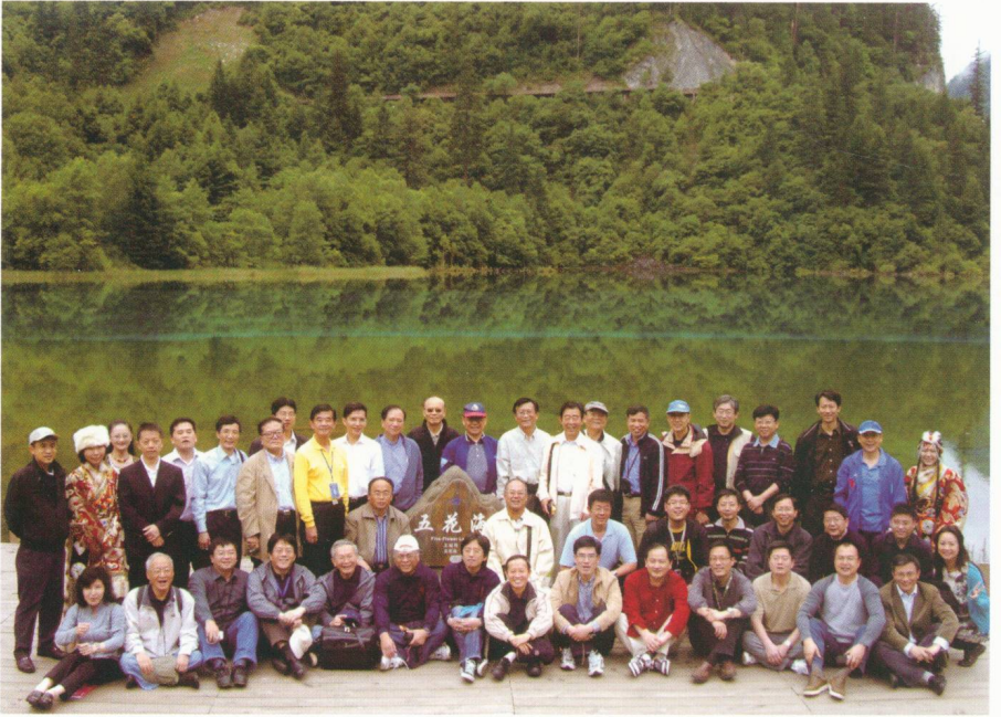
—兩岸學者於會後遊歷九寨溝，攝於五花海。