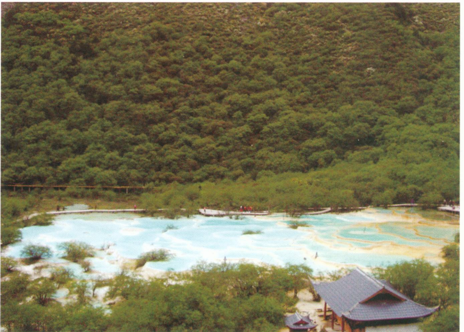
黃龍的五彩池 (池水會隨陽光照射角度不同，顯現五種色彩，故有此名)