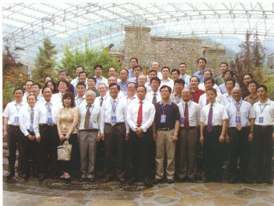
二岸所有與會學者於會場外合照留念