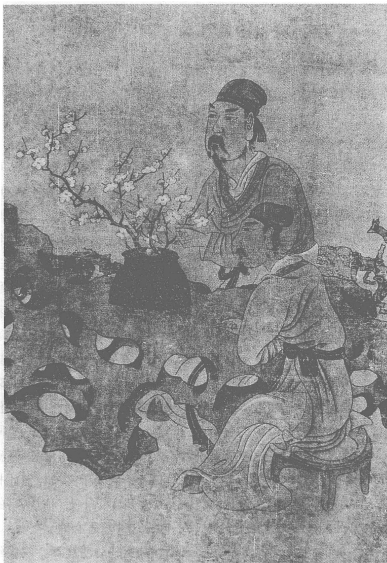
图二 居士赏梅（局部）