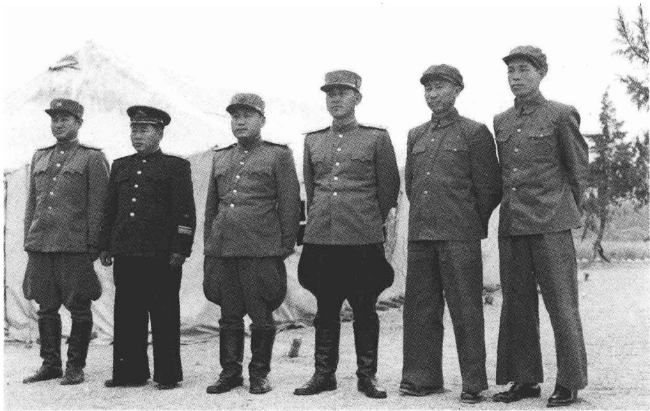
1952年7月，参加朝鲜停战谈判的中朝谈判代表（从右至左）：联络官柴成文上校、中国人民志愿军代表解方将军、朝鲜人民军代表南日将军、李相朝将军、联络官张春山上校、朝鲜人民军代表金元武将军在开城板门店合影