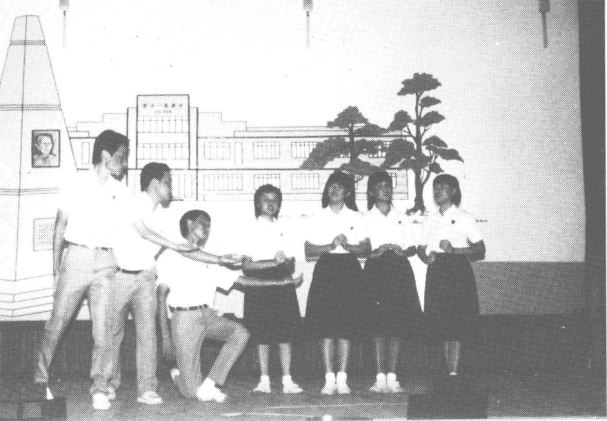
砂拉越古晋中华第一中学的学生在毕业「叙别文娱晚会」上朗诵田思的「纪念碑」。(一九八五年)