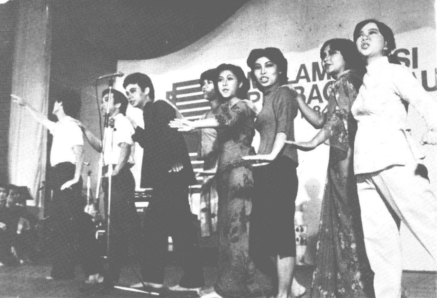
雪兰莪福建会馆青年组在「各民族诗歌朗诵会」上，朗诵田思的「心桥」，作为序幕节目。（一九八四年）