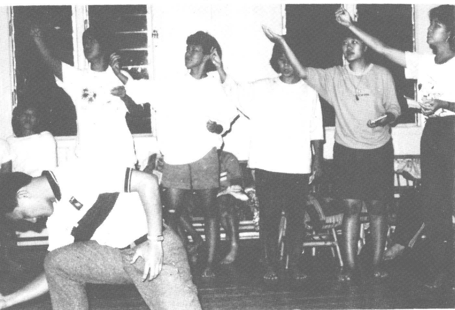
吉隆坡「新流小组」正在排练田思的「海鸥」，准备在「青运文娱晚会」上造型朗诵。（一九八四年）