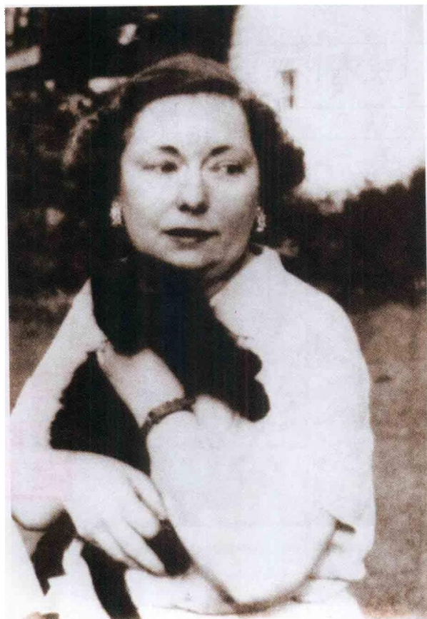
米切尔生前最后一张照片

摄于1949年夏天皮德蒙特公园。此后不久，米切尔在亚特兰大不幸遭遇车祸而离开人世。