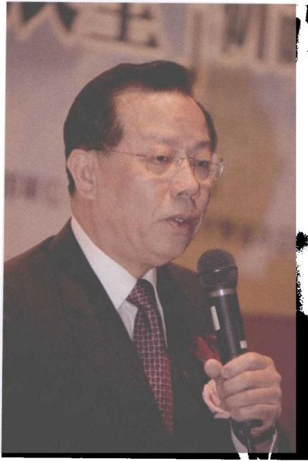
我國駐世界貿易組織首任大使 顏教授慶章