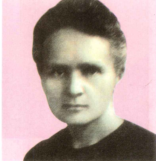
百世流芳 (梁衡《跨越百年的美丽》)