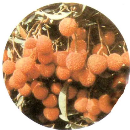
满枝荔枝丹 (贾祖璋《南州六月荔枝丹》)