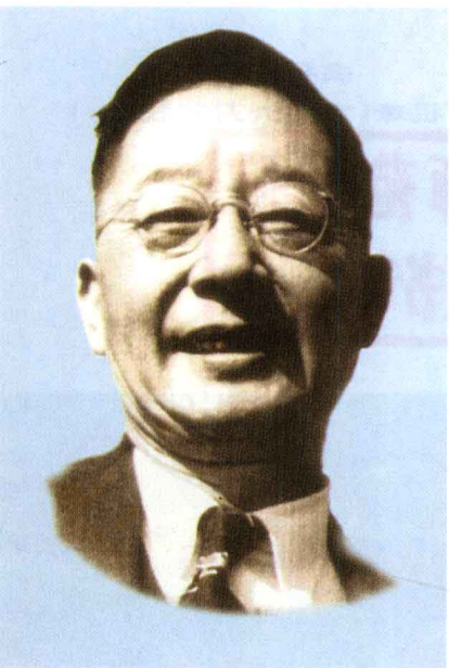
语言大师 (老舍《怎样学习语言》)