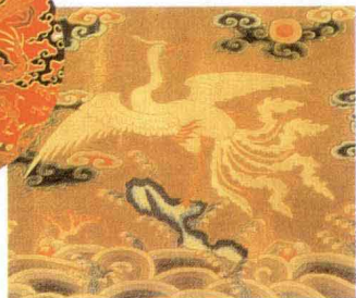
花团锦簇 (吴晗《古代的服装及其他》)