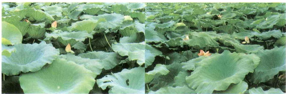
绿盖叠翠 (郑伯琛《荷叶咏》)