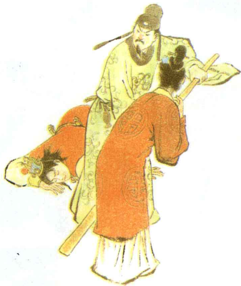
宝玉挨打 (曹雪芹《红楼梦》)