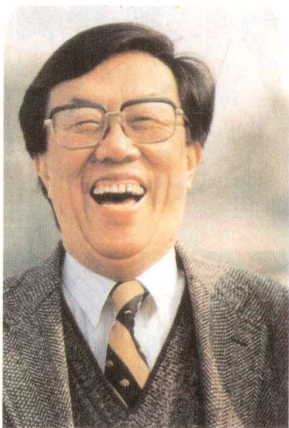
至善极乐 (王蒙《善良》)