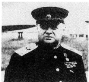
梅列茨科夫 | Kirill Meretskov

苏军出兵神速，使日军没有来得及实行“焦土”政策，而我们满意地看到了和平居民劫后幸存的家屋。