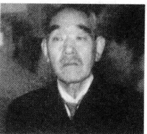
铃木贯太郎 | Kantaro Suzuki

苏军在远东的战局是第二次世界大战的最后阶段。在亚洲大陆遥远的“咱们的”土地上，有保卫苏维埃祖国的大规模战争史上的最后一个点。