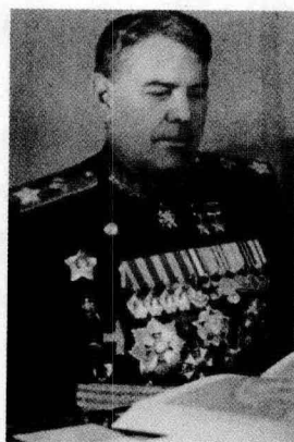
华西列夫斯基 | Alexandr Vasilevsky

苏联元帅。苏德战争期间, 1941年8月任副总参谋长兼作战部部长。1942年5月任总参谋长, 10月兼任苏联国防人民委员。1943年2月晋升为苏联元帅。1945年2月, 任白俄罗斯第3方面军司令员。德国投降后, 出任远东苏军总司令, 成功地组织实施了消灭日本关东军的战略性攻击战役。