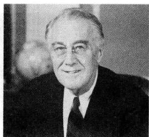
罗斯福 | Franklin Roosevelt