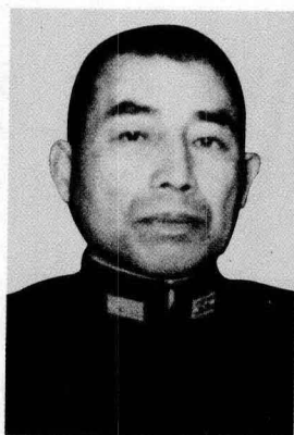
山田乙三 | Otozo Yamada

日本陆军大将。1937年任第12师师团长, 参加侵华战争。1938年任第2军司令官。1939年任教育总监兼军事参议官, 后兼任防卫总司令官。1944年出任关东军司令官, 后率部向苏军投降。后被关押在苏联西伯利亚, 1956年获释。