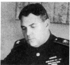
华西列夫斯基 | Alexandr Vasilevsky

苏军出兵神速，使日军没有来得及实行“焦土”政策，而我们满意地看到了和平居民劫后幸存的家屋。