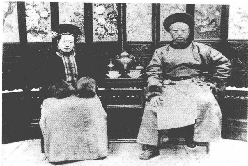
奕譞与福晋叶赫那拉氏合影

他的长子载瀚两岁夭折。他现在没有任何一个子女。他期盼着爱妻给他生一位哥儿，不然，格格（女儿）也行。