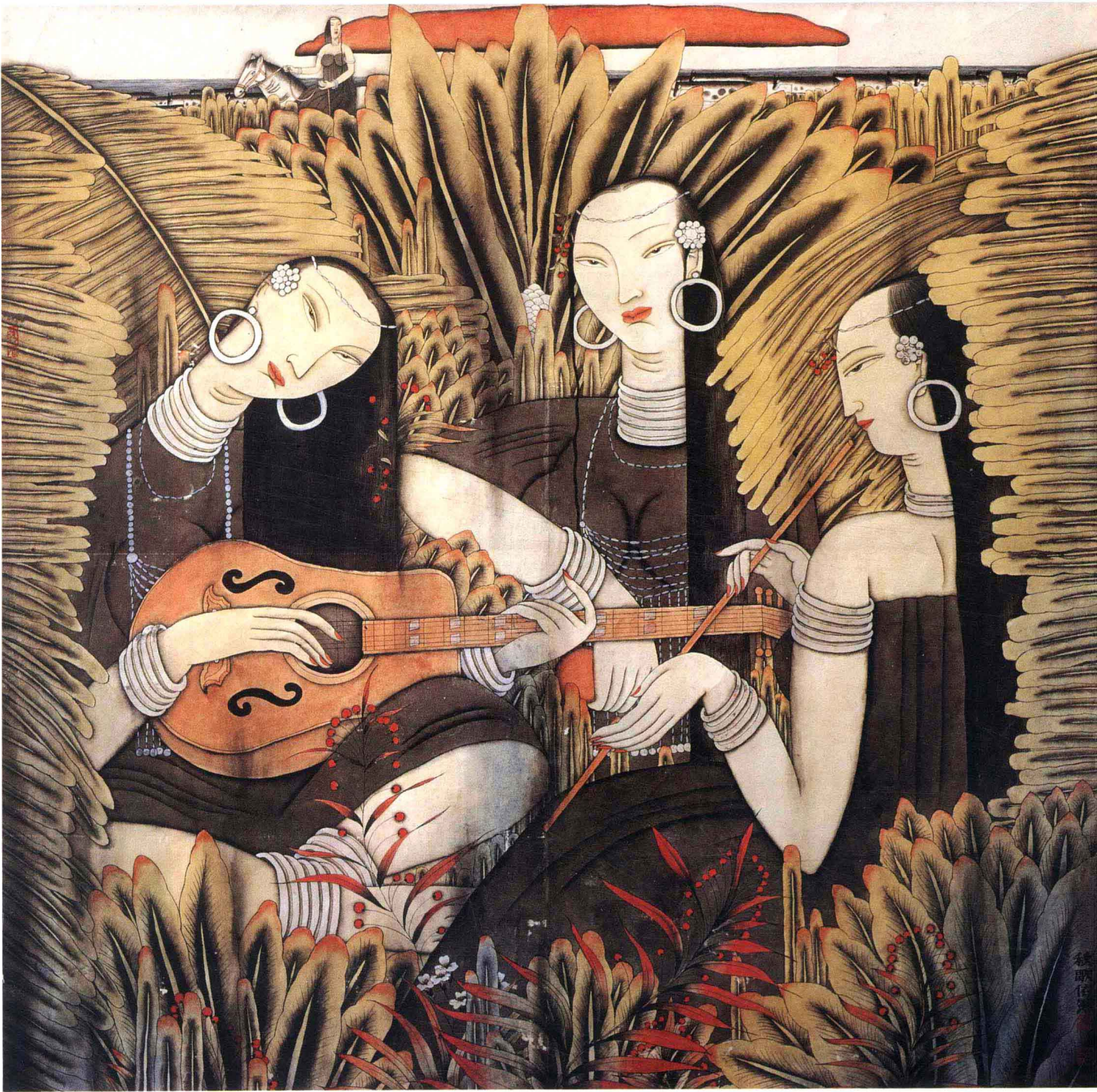
③秋歌依然(133 × 132 cm) · 李鼎成