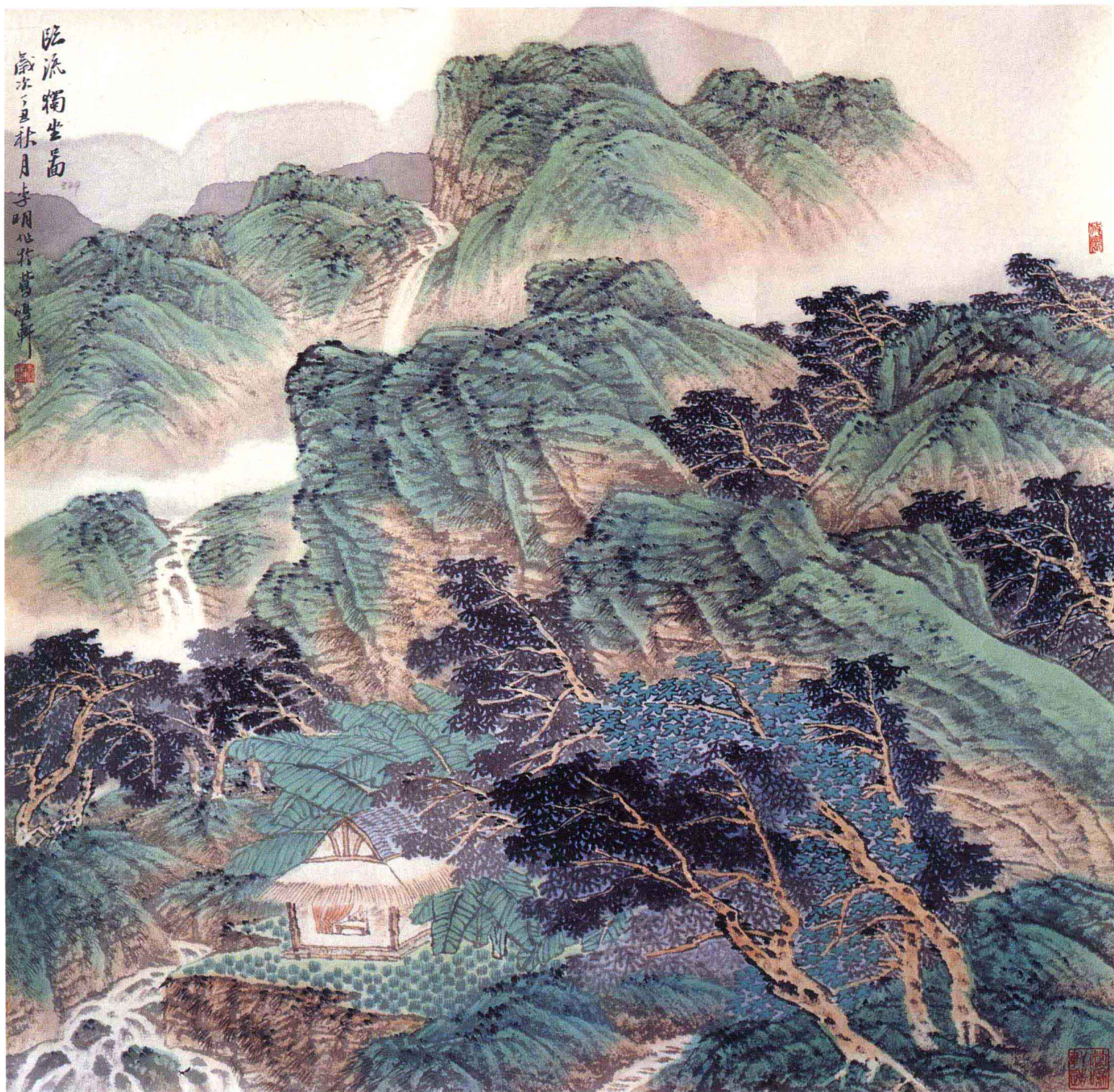
⑦臨流獨坐圖(69×70 cm)·李 明