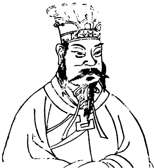
漢 武 帝 像

费很多,生怕皇帝怪罪,就开始骗他,反正编个故事也不难。没有想到,秦始皇还真是想“蓬莱药”想疯了,日有所思,夜有所梦,居然与龙宫海神梦中大战了三百回合。后来沿山东半岛几乎转了一圈,直到之罘,即今天的烟台一带海域,才射杀了一大鱼。