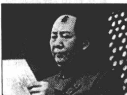
毛泽东庄严宣告，中华人民共和国成立

毛泽东，字润之，笔名子任。1893年12月26日生于湖南湘潭韶山冲一个农民家庭。1976年9月9日在北京逝世。中国人民的领袖，马克思主义者，伟大的无产阶级革命家、战略家和理论家，中国共产党、中国人民解放军和中华人民共和国的主要缔造者和领导人，诗人，书法家。