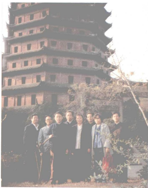
1986年受市委委派率队赴温州考察学习乡镇企业，同行有市委调研室，乡镇企业局，市人民银行、农业银行的领导。