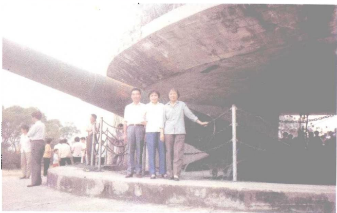
1987年与市委政策研究室同志赴汕头、福建考察学习。上图：在饶平县参观脐橙果园与该县有关领导留影。下图：在厦门前线炮台留影。