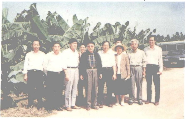
1992年原省委书记任仲夷（左四）来湛江考察。图为在吴川参观博铺坡农业开发。前排左三为市委副书记陈周攸、右四为吴川书记肖里华、右二为吴川人大主任张军、右三为作者。

1990年8月时任省委书记林若（前排中间）来湛江视察。这是他在徐闻和安镇养虾池边与当地干部群众共商养殖业的发展（前排左一为作者）转自南方日报1990年9月6日报导。