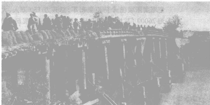
新四军三师进军东北途中