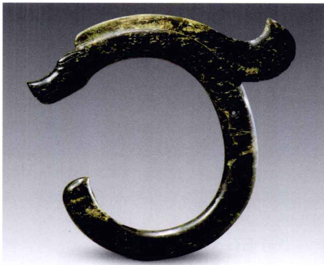
图1-2 红山文化玉龙_新石器时代

截面为椭圆形，通体为素面，背上有一长鬣卷起，边缘锋利。龙的头部用棱线雕有眼睛的形象，吻部向上噉起，正面有两个对称的圆洞为鼻孔，嘴下颚底及额头细刻方格网状纹。龙体正中有一小穿孔，用以穿绳悬挂。如此精美的玉石雕刻，说明我们的祖先们早在五六千年前就掌握了一套熟练而有效的攻玉技术，也使我国古代在世界上就有“玉国”之称。