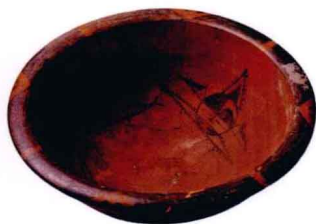
图1-4 人面鱼纹彩陶盆_新石器时代