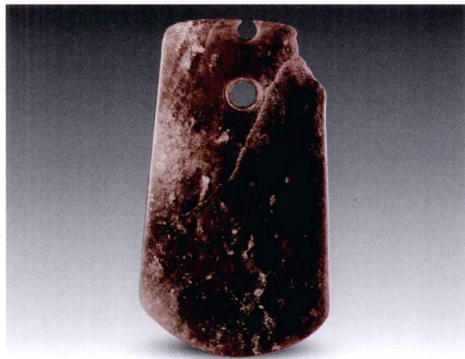
图1-1 石铲_新石器时代

随着人们对石器材质的进一步认识和加工技术的不断提高,以及人们审美需求的不断丰富,与石器生产紧密关联的玉石工艺也就随之发展起来,并成为一个个独立的艺术品种。