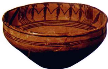
图1-8 舞蹈纹彩陶盆_新石器时代