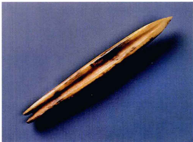
图1-13 骨梭_新石器时代