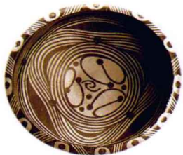
图1-7 马家窑彩陶_新石器时代