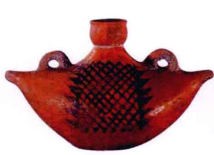
图1-5 船形网纹彩陶壶_新石器时代