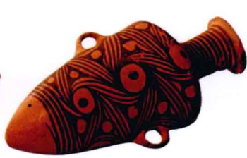
图1-6 旋纹双耳尖底瓶_新石器时代

是其典型纹饰(图1-3)。在原始人的生活中,渔猎是其主要的的生活方式,鱼是最主要的生活资料之一,因此他们自然会对鱼表现出更多的关注。从客观上来看,他们对鱼的形体结构非常熟悉,利于表现;从主观上来看,他们认为鱼繁殖力强,为他们提供了丰富的食物来源,对它们进行一种具有原始宗教性的表现,寄托了他们对生活的某种向往。人面鱼纹彩陶盆(图1-4)就给后人提供了这种具有巫术性的观念信息。这些装饰纹样不仅表现了他们丰富的想象力,也反映了他们惊人的表现力。他们已掌握了抽象表现形式的众多规律与法则,把对称、平衡、节律、对比等都运用得非常适当和精彩。除动物纹外,半坡型彩陶中也出现了不少几何纹,线条多为直线,构成网纹、三角形纹、折线纹等,在两根折线间空白处也形成一条折线,这是最早使用黑白双关效果的范例。在半坡彩陶中,有一件葫芦形壶,其纹饰是一粗犷而抽象的人面纹,整个器形宛如一尊雕塑,颇具特点。另一件船形网纹彩陶壶也很有创意,其形如船,其纹如网,表现非常贴切(图1-5)。