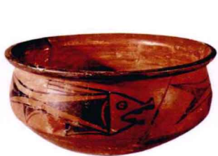
图1-3 鱼纹盆_新石器时代