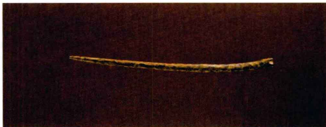
图1-12 骨针_新石器时代

缝制皮衣，开始用的线为兽筋，逐步用葛、麻、藤等植物纤维做线，逐渐发展成用这些纤维质材料织网，细而成布。两河流域新石器遗址中出土了大量骨针、骨椎、陶纺轮、石纺轮、木纺轮、绕线棒等。（图1-12、图1-13）从一些陶器的麻布印纹上看，每平方厘米上已有经纬线各10根。龙山文化中更有了骨梭的出现，说明已有了较好的纺织工具和技术。