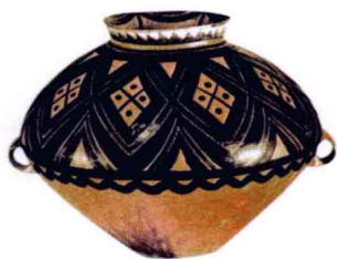
图1-9 半山型彩陶罐_新石器时代