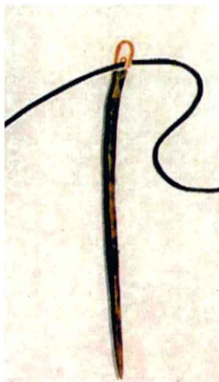
图1-11 山顶洞人骨针_新石器时代

至于纺织与衣饰，由于时代久远已无实物可考。据《韩非·五蠹篇》载：“古者丈夫不耕，草木之实足食也；妇人不织，禽兽之皮足衣也。”但进入新石器时代后，人类已开始有了纺织和丝织的衣料。《商君书·画策篇》云：“神农之世，男耕而食，妇织而衣……”这说明人类已有了成形的衣服。同时，我们也可以从出土文物中得到佐证，如山顶洞人使用过的骨针（图1-11），表明人们已用针来