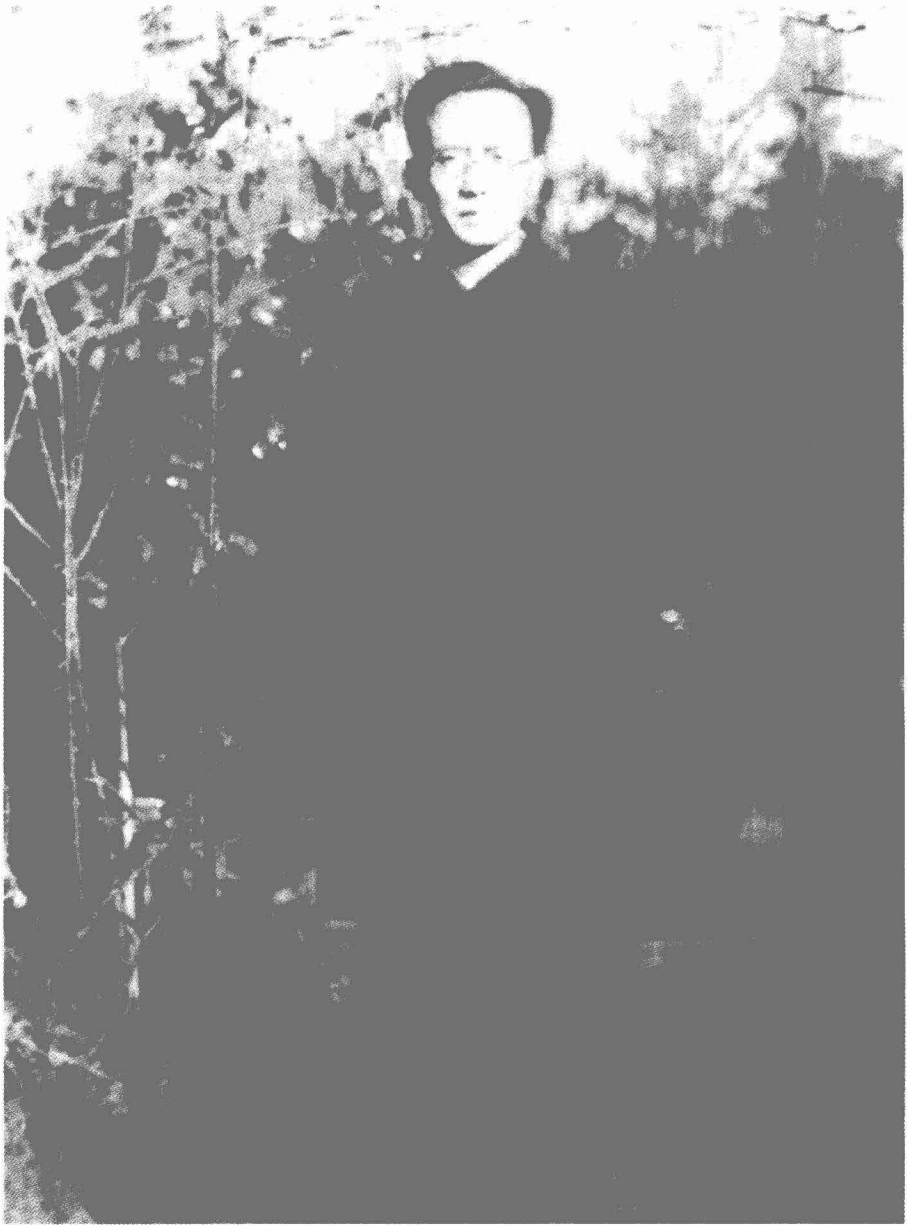
一九三六年前后在日本须和田