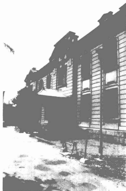
《别录之二·日本所藏甲骨掇尤》中所录甲骨收藏处之近影 东洋文库(右上)、京都大学考古学教室(右下)、 东京大学考古学教室(左上)、上野博物馆(左下)