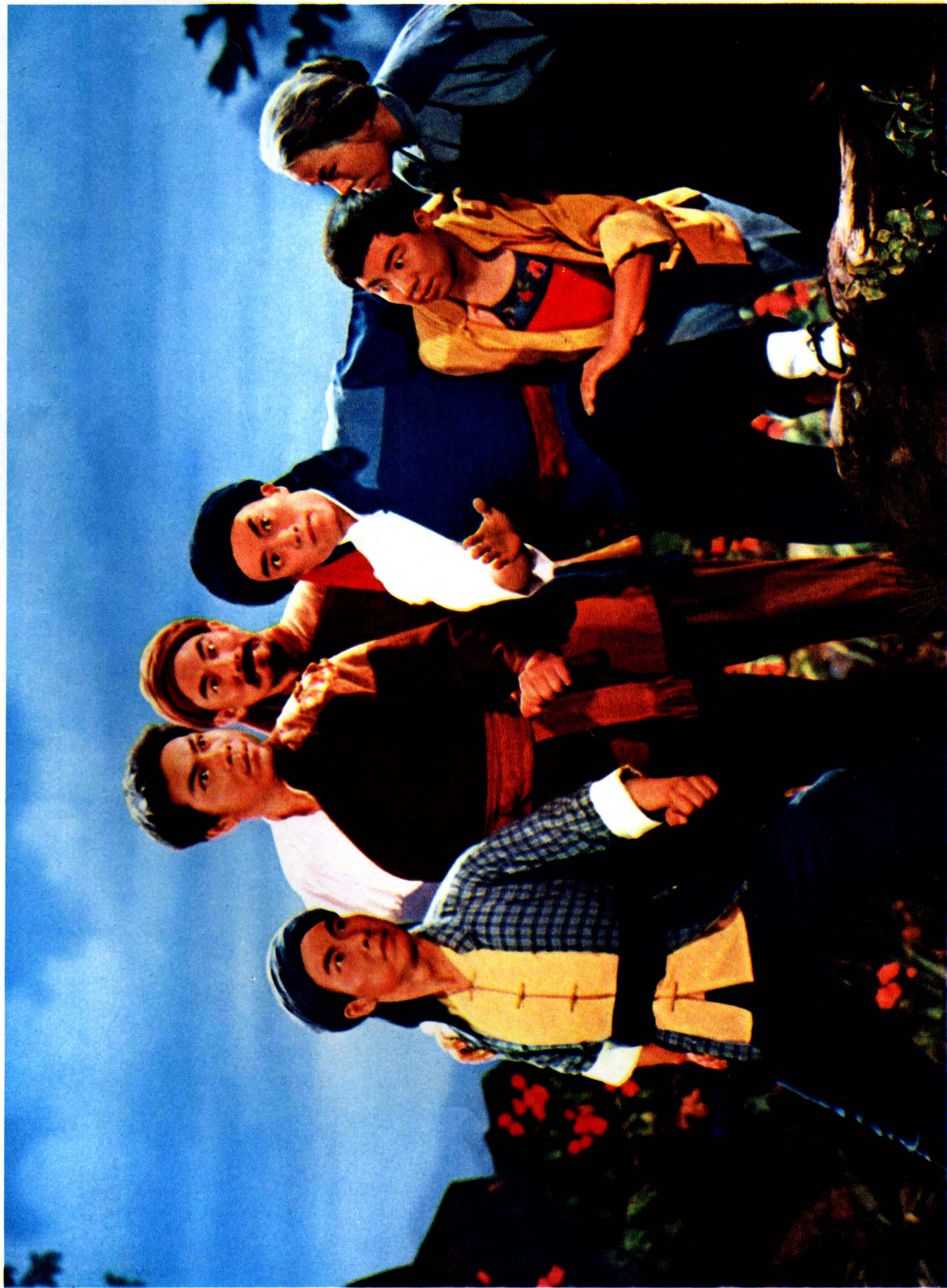
3 杜鵑山农民自卫军三起三落，处境危急，处境危急，他们在艰苦的斗争中急切地盼望找到中国共产党领导路向前。（第一场《长夜待晓》）