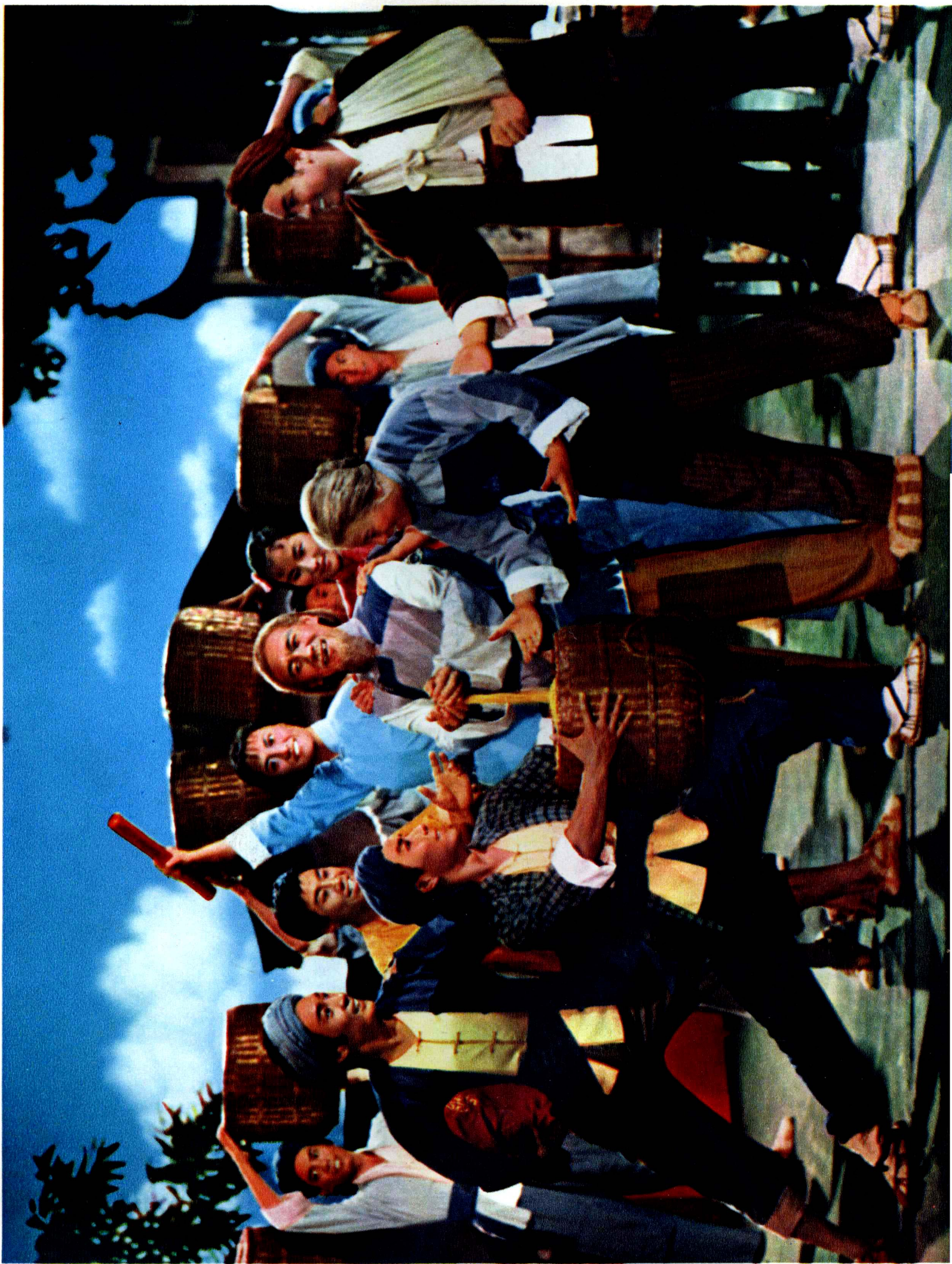
6 在中国共产党的领导下，农民自卫军打土豪，分衣分粮，发动群众，扩大武装，蓬勃向上。（第三场《情深如海》）