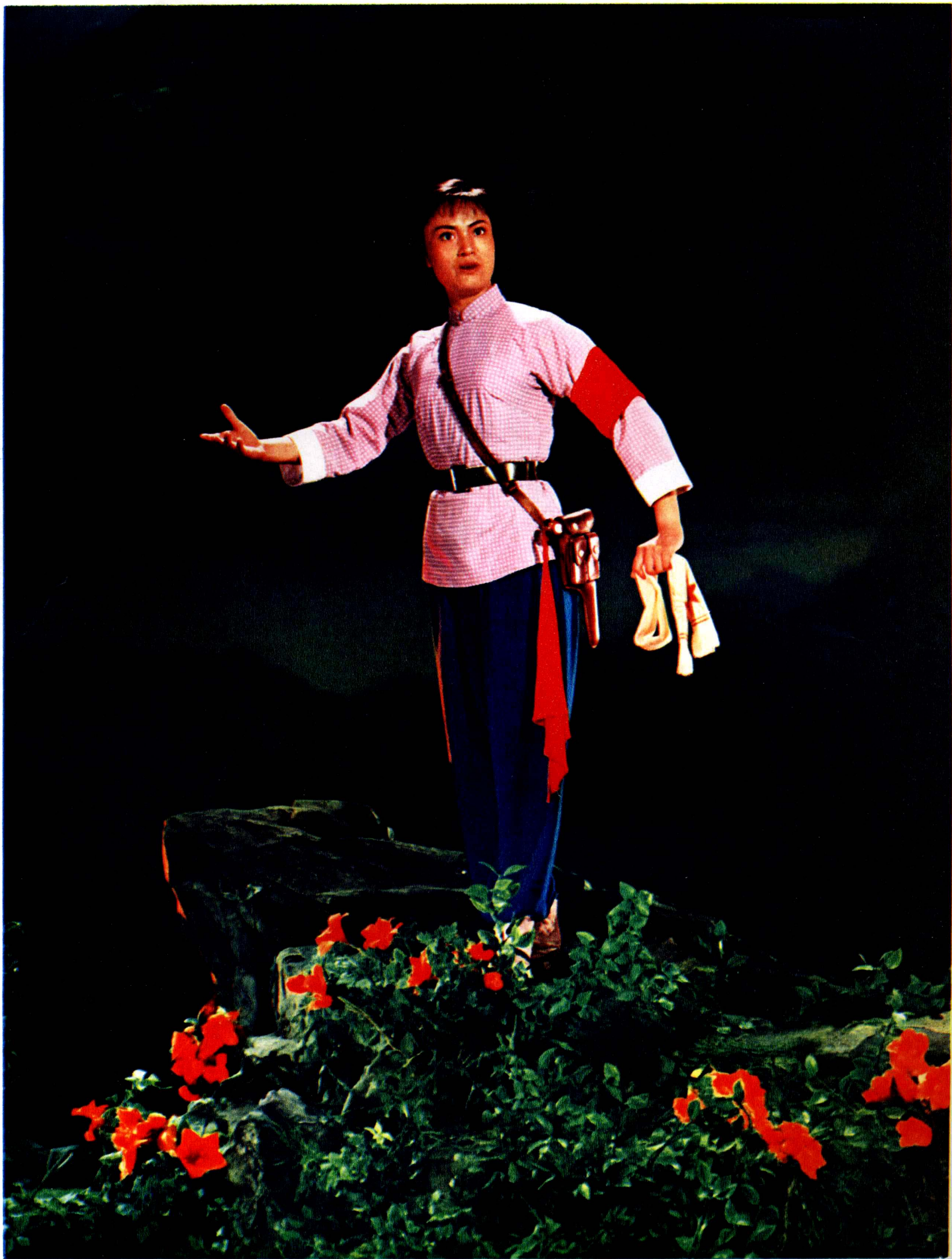
9 “望长空，想五井，似看到万山丛中战旗红，毛委员指航程，光辉照耀天地明！” 在严重的局势面前，柯湘想起毛委员，力量倍增。（第五场《砥柱中流》）