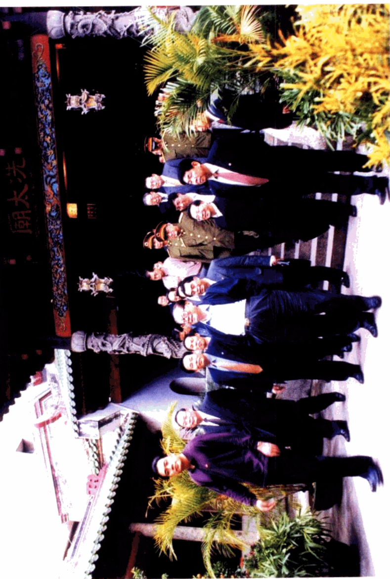
2000年2月江泽民总书记视察高州洗太庙