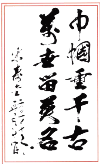
茂名市委常委、 宣传部部长宋寿金题 词