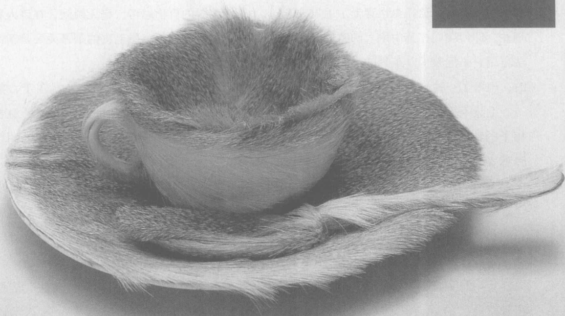
奥本海姆 《毛皮茶杯》 1936 装置作品

她同样也具有把我们司空见惯的东西陌生化的能力。她和玛格利特一样，因凭借“奇特技法”创作出奇特的作品而风靡世界。