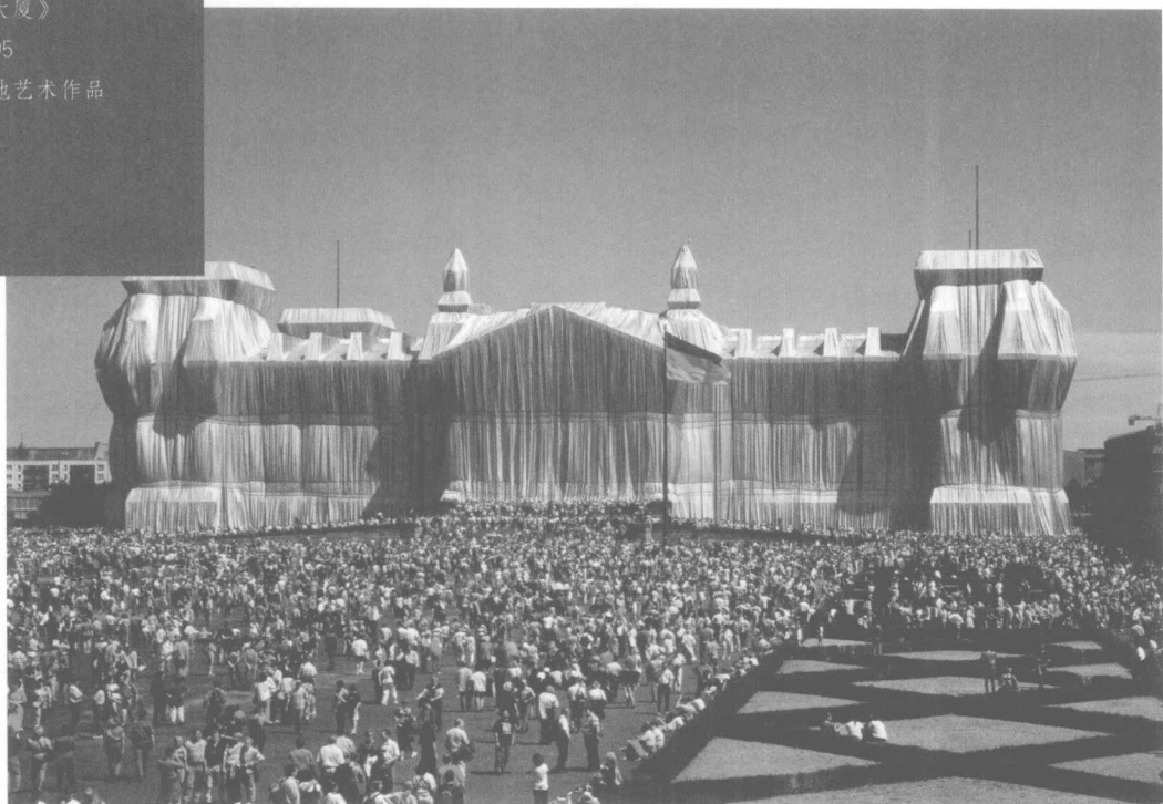
克里斯托夫妇 《包裹德国柏林会 议大厦》 1995 大地艺术作品

的记忆，回想建筑物原本的颜色与形状。这就如同常在身边的人忽然消失的时候，自己会有空虚感一样。