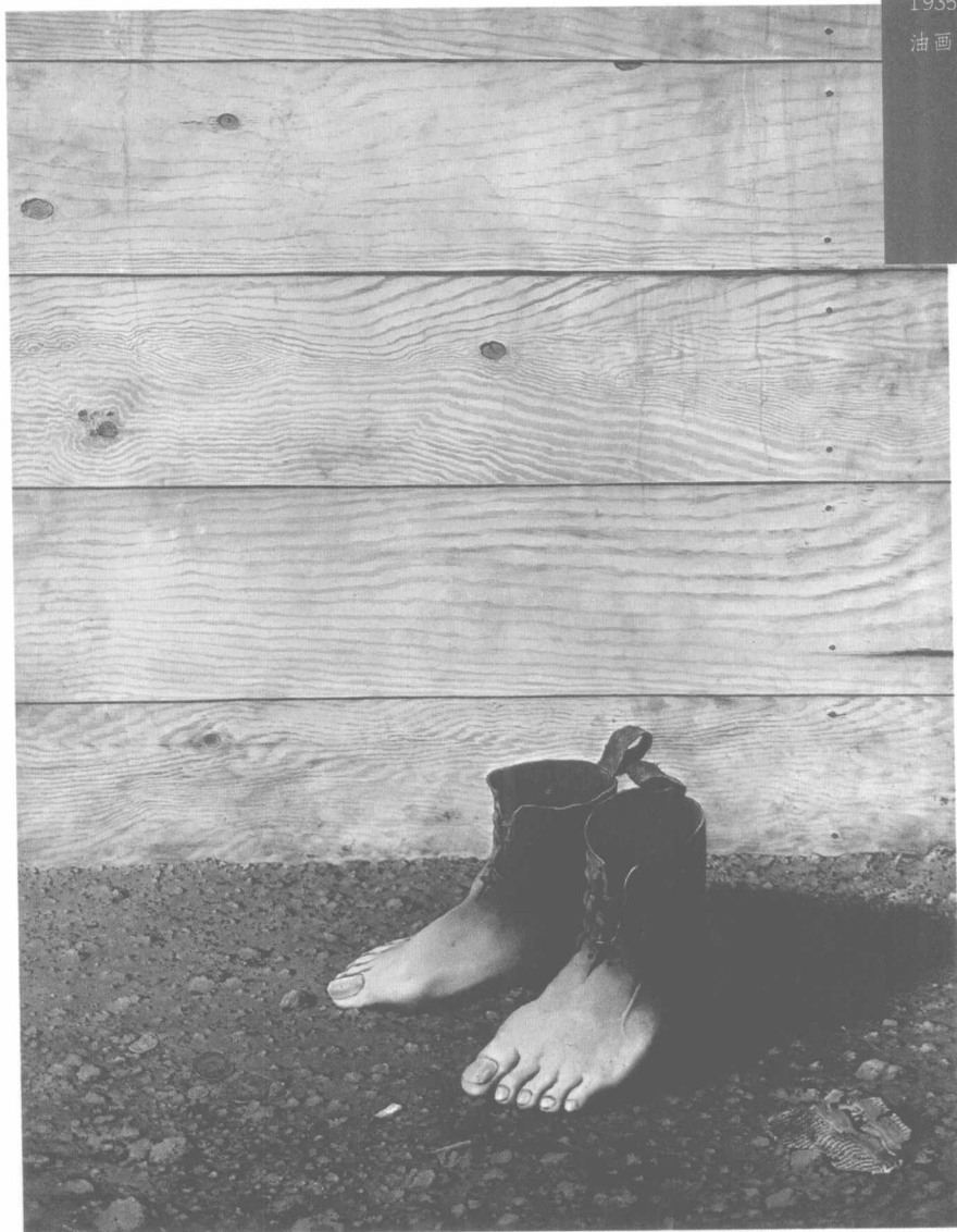
玛格丽特 《红色模型》 1935 油画