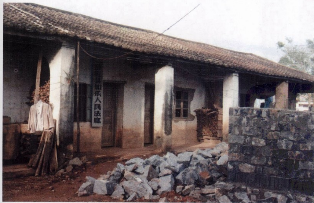
20 世纪 80 年代澄迈加乐人民法庭(位于澄迈县加乐镇政府所在地)