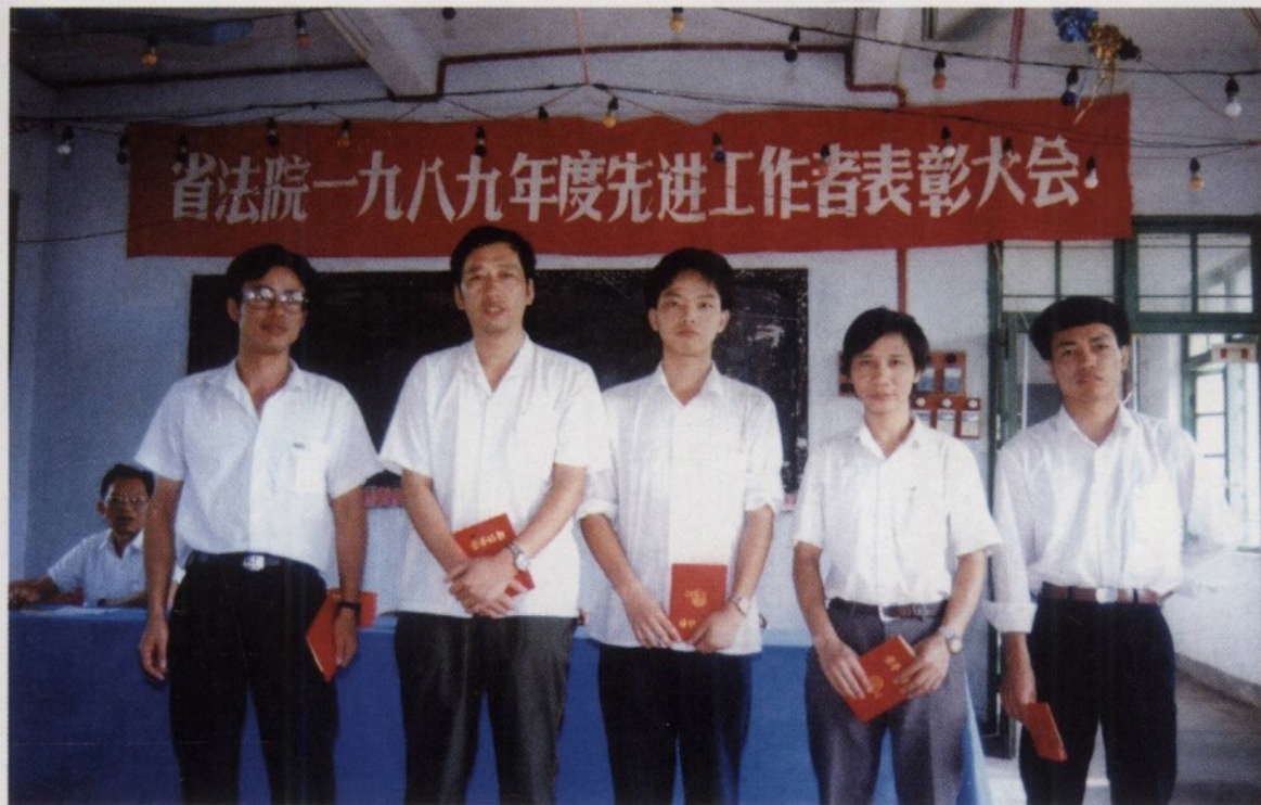
海南省高级人民法院 1989 年度先进工作者合影