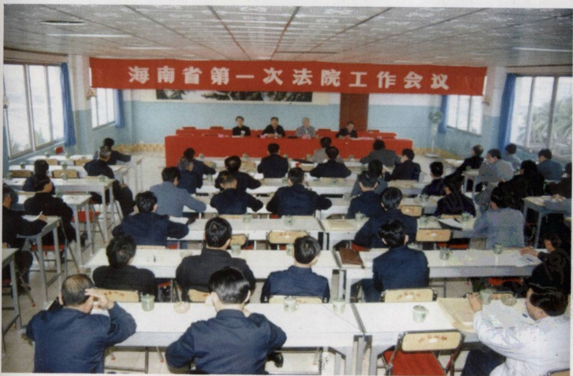
1989年1月6日至9日,海南省第一次法院工作会议在海口召开