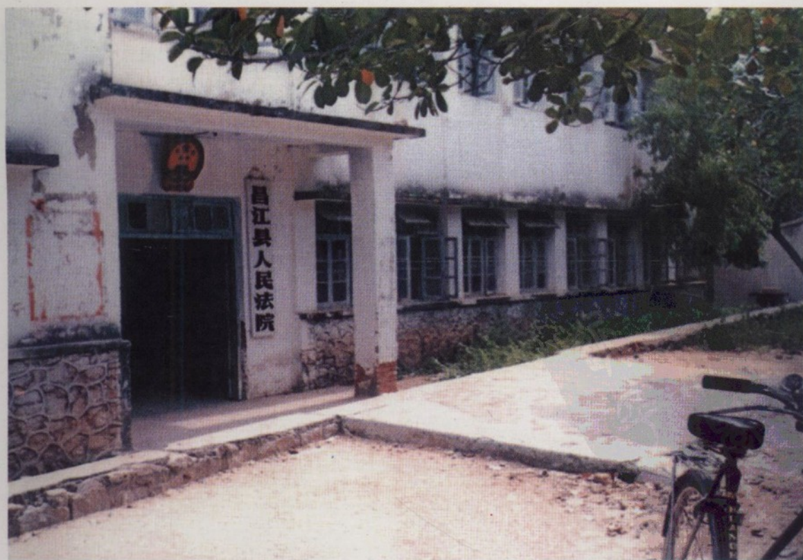
20 世纪 70 年代昌江县人民法院办公场所