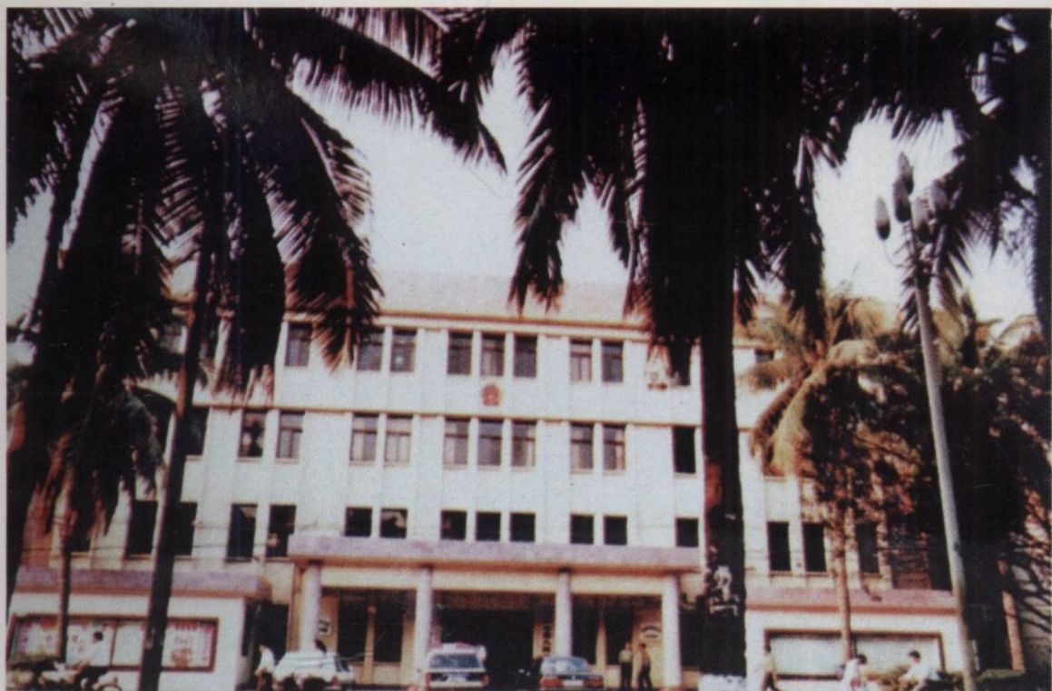
海口市人民法院 20 世纪 80 年代办公楼(位于海口市广场路一号)