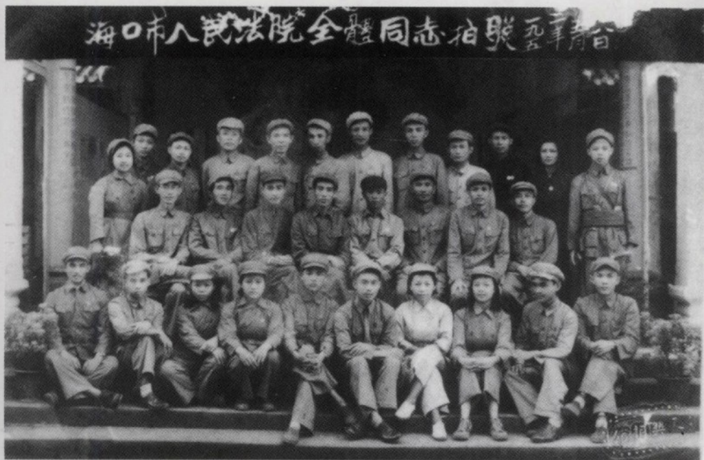
1952年5月8日,海口市人民法院全体同志合影