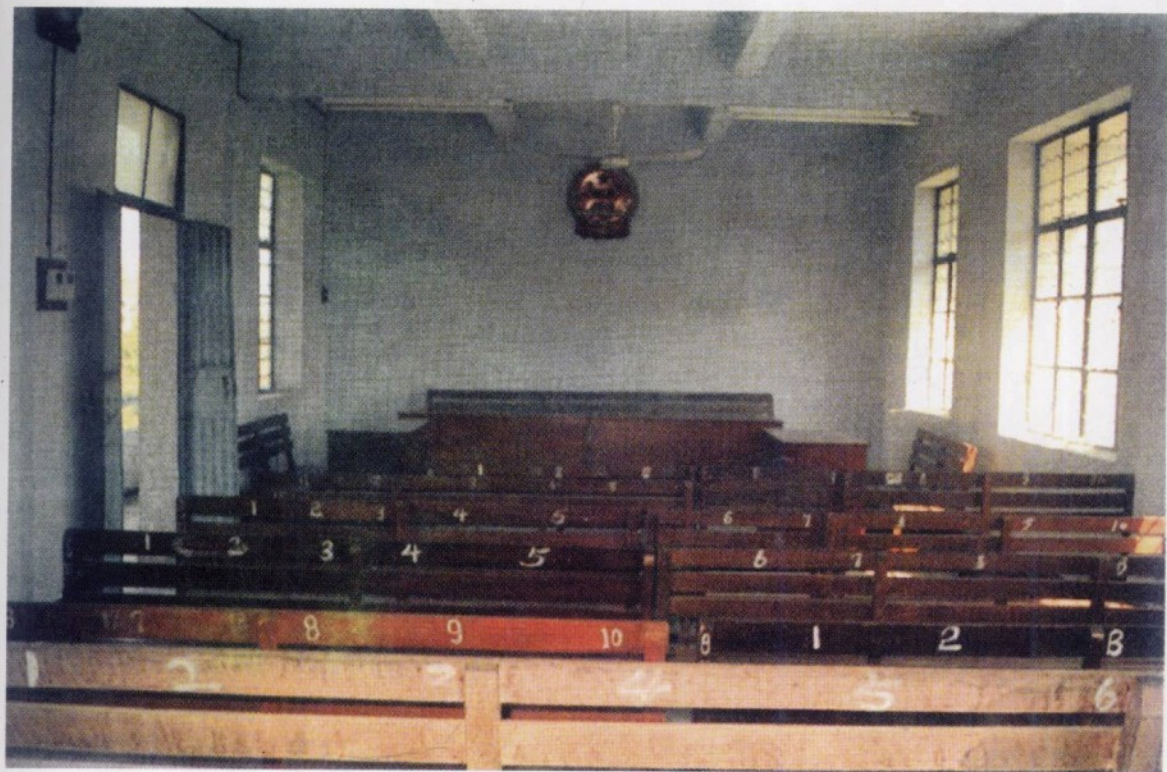
20 世纪 70 年代的昌江县矿区人民法庭(位于昌江县城)