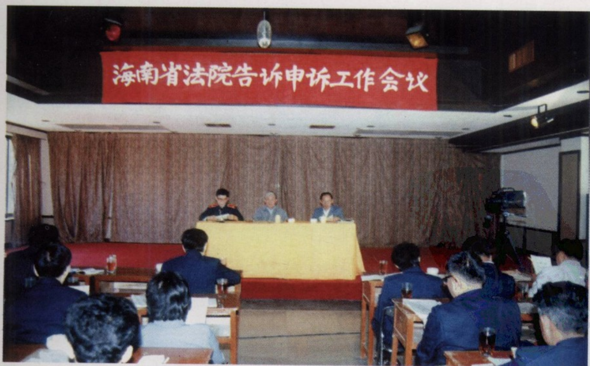
1989年12月12日至20日,海南省法院告诉申诉工作会议在通什市召开