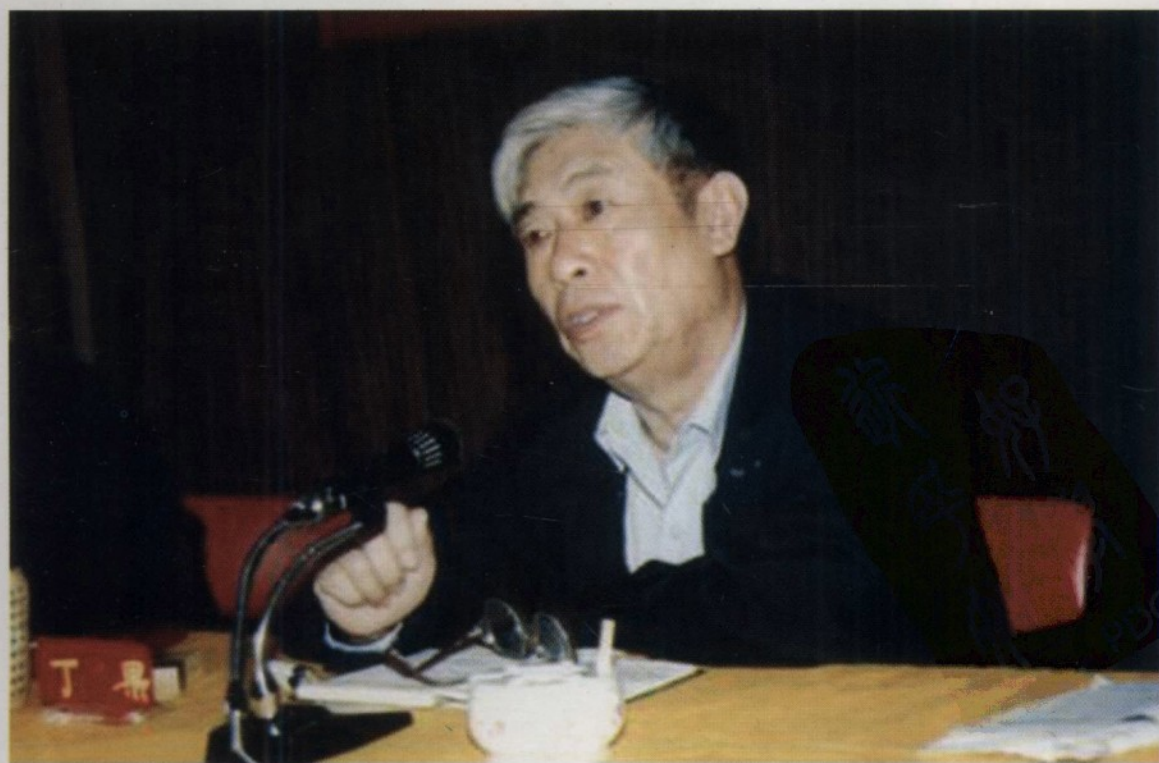
海南省高级人民法院首任院长丁果在1989年全省法院工作会议上讲话