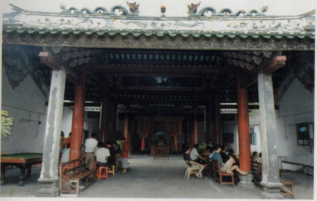
20 世纪 50~60 年代海口市人民法院审判法庭（位于海口市得胜沙路西天庙内）