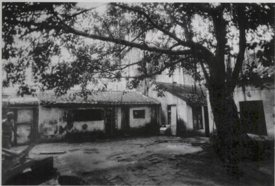
20世纪50年代海口市人民法院法官宿舍(位于海口市得胜沙路西天庙后面)