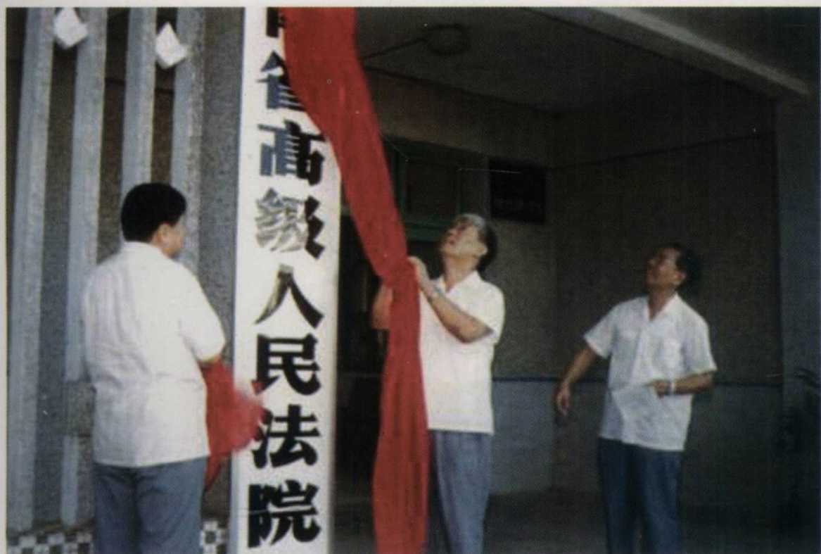
1988年9月6日,海南省人大常委会副主任曹文华(左一)同海南省高级人民法院第一任院长丁果(左二)为海南省高级人民法院挂牌揭幕。