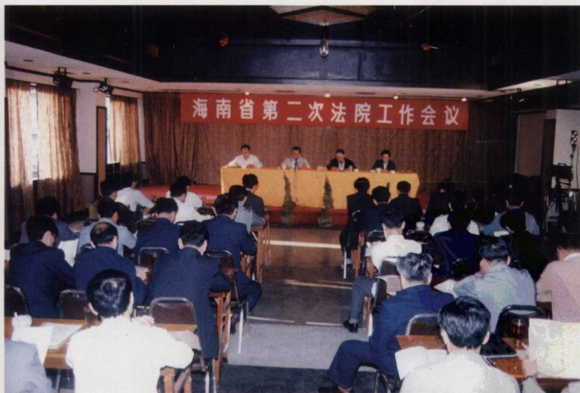
1990 年 3 月 21 日至 24 日,海南省第二次法院工作会议在通什市召开