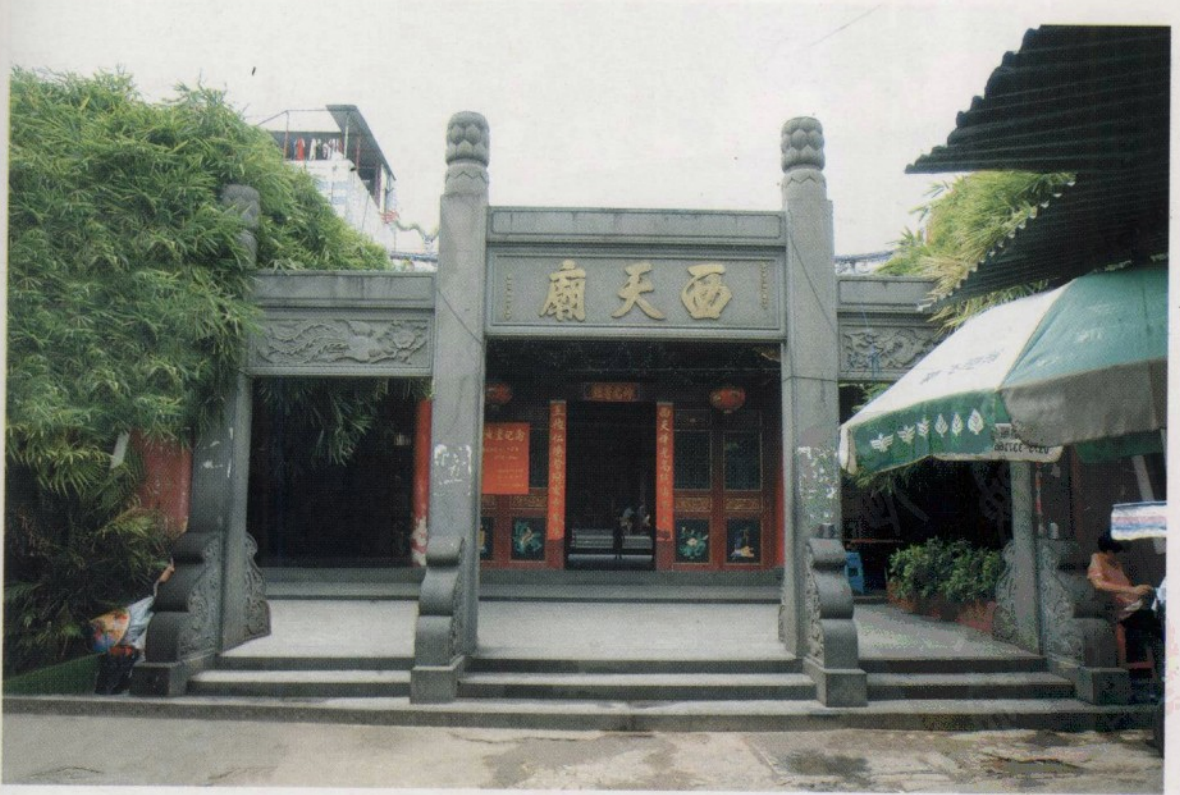
1950 年 7 月 1 日,海口市人民法院成立时办公地点(位于海口市得胜沙路)