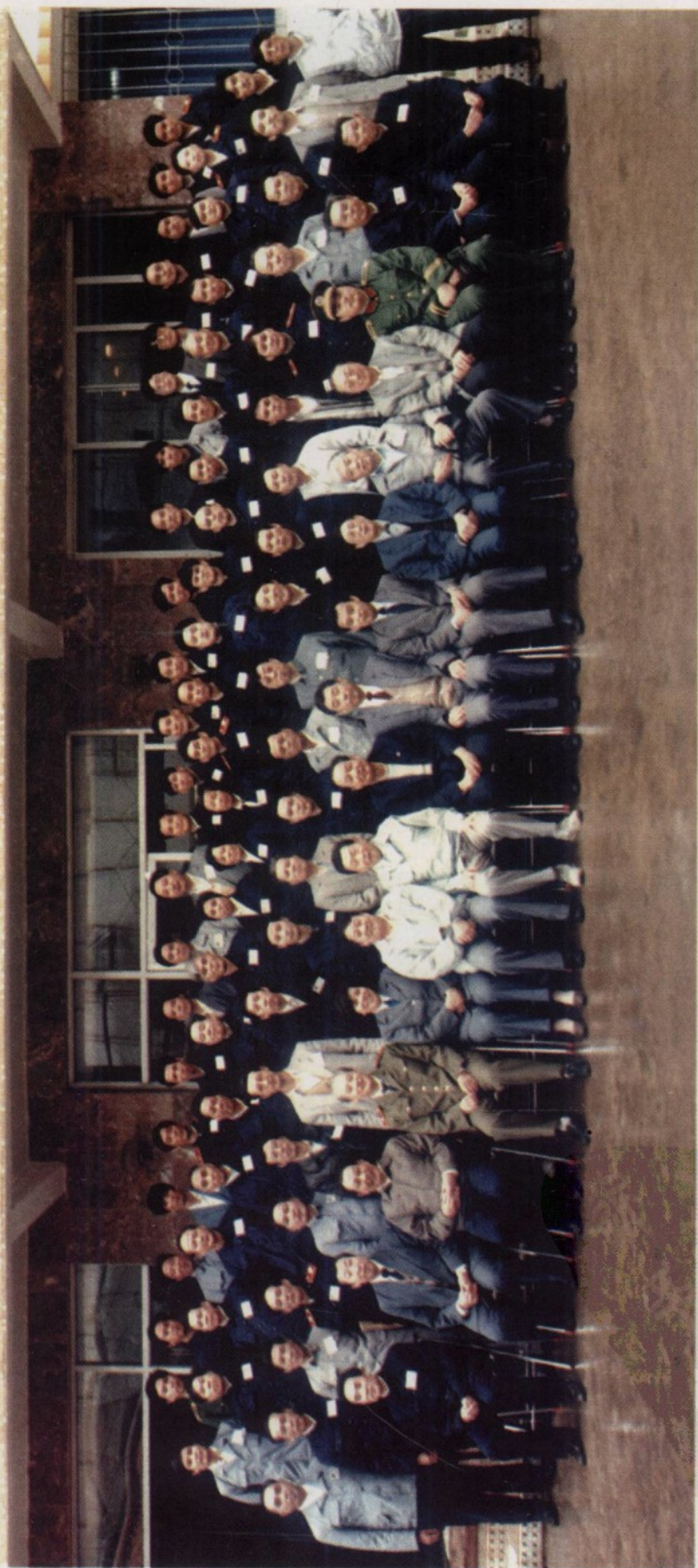
1989年1月6日,海南省省长梁湘(前排左八)、省委副书记刘剑峰(右八)、省政协主席姚文绪(左七)、副省长鲍克明(右七)、省委书记董范园(左五)、省人大常委会副主任曹文华(左六)、省高级人民法院首任院长丁果(右五)与海南省第一次法院工作会议全体代表合影