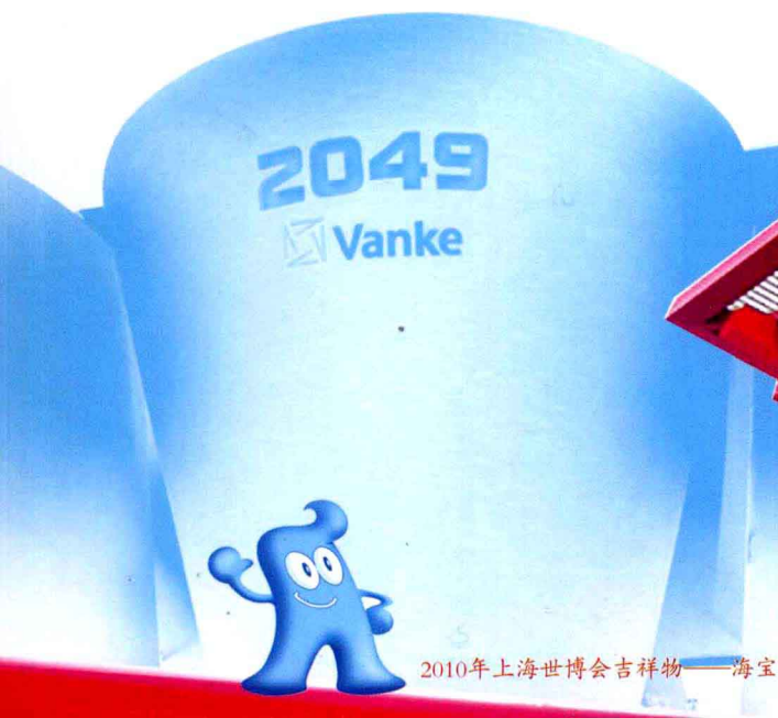
2010年上海世博会吉祥物——海宝