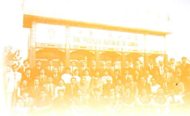
1982年美国诺克斯维尔世博会中国馆工作人员合影

世博会早期，清朝政府认为它是“西洋人的赛奇会”。在他们眼中，西方工业革命的成果是不值得一提的“奇技淫巧”，所以清朝政府没有派遣代表团参加前几届世博会。直到1873年维也纳世博会，清朝政府才派遣以“赫德”为代表的清一色洋人代表团赴会。然而在前几届的世博会上，其实出现过留着“长辫子”的中国人，他们是民间自发组织参与世博会的。1904年，清朝政府派溥伦贝子成立专职委员会前往圣路易斯世博会，国外媒体将此称为是“中国政府正式登上世博会舞台的开端”。