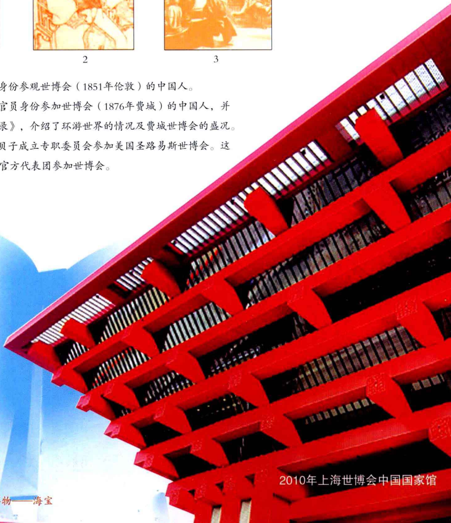
2010年上海世博会中国国家馆