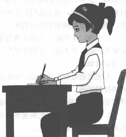
图2-1 钢笔写字姿势示意图