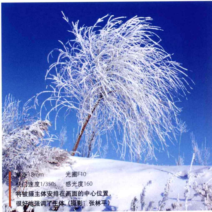
焦距18mm 光圈F10 快门速度1/350s 感光度160 将被摄主体安排在画面的中心位置， 很好地强调了主体

而在下图这幅作品，摄影师巧妙地将布满痕迹的土地安排在画面的前景位置，凌乱的痕迹将人们的视线逐渐引入远方，很好地强调了主体环境的质感，同时增强了作品的视觉效果，强化了主题氛围。