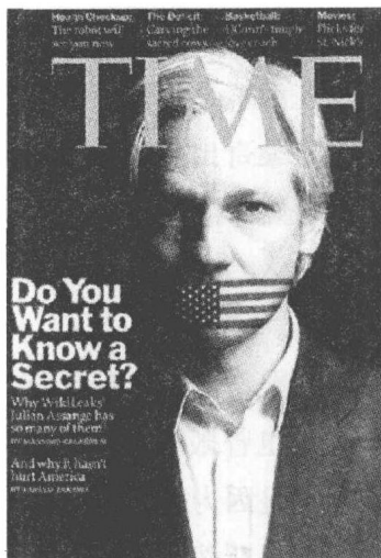
维基解密创始人阿桑奇登上《时代周刊》封面

与阿桑奇合作出版过《地下世界》一书的伙伴，澳大利亚女作家赛利特·德累福斯回忆说：“这个皮肤和头发同样苍白、瘦削，谈话中经常间歇性出现沉默的年轻人，很少谈及自己的生活细节，但同时似乎又对自己拥有的秘密而感到焦虑，游移在倾吐欲和某种自我保护的本能之间。”