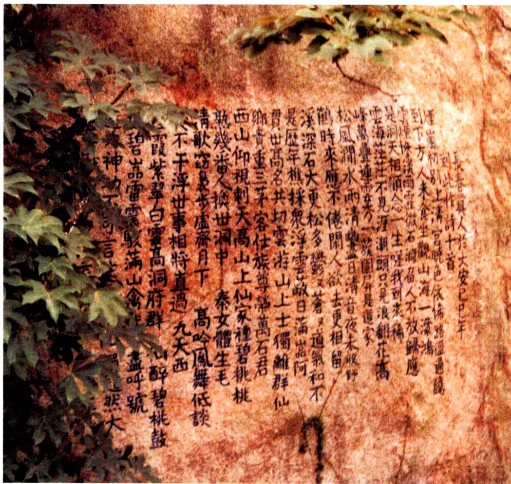
崂山太清宫邱祖詩摩崖刻石