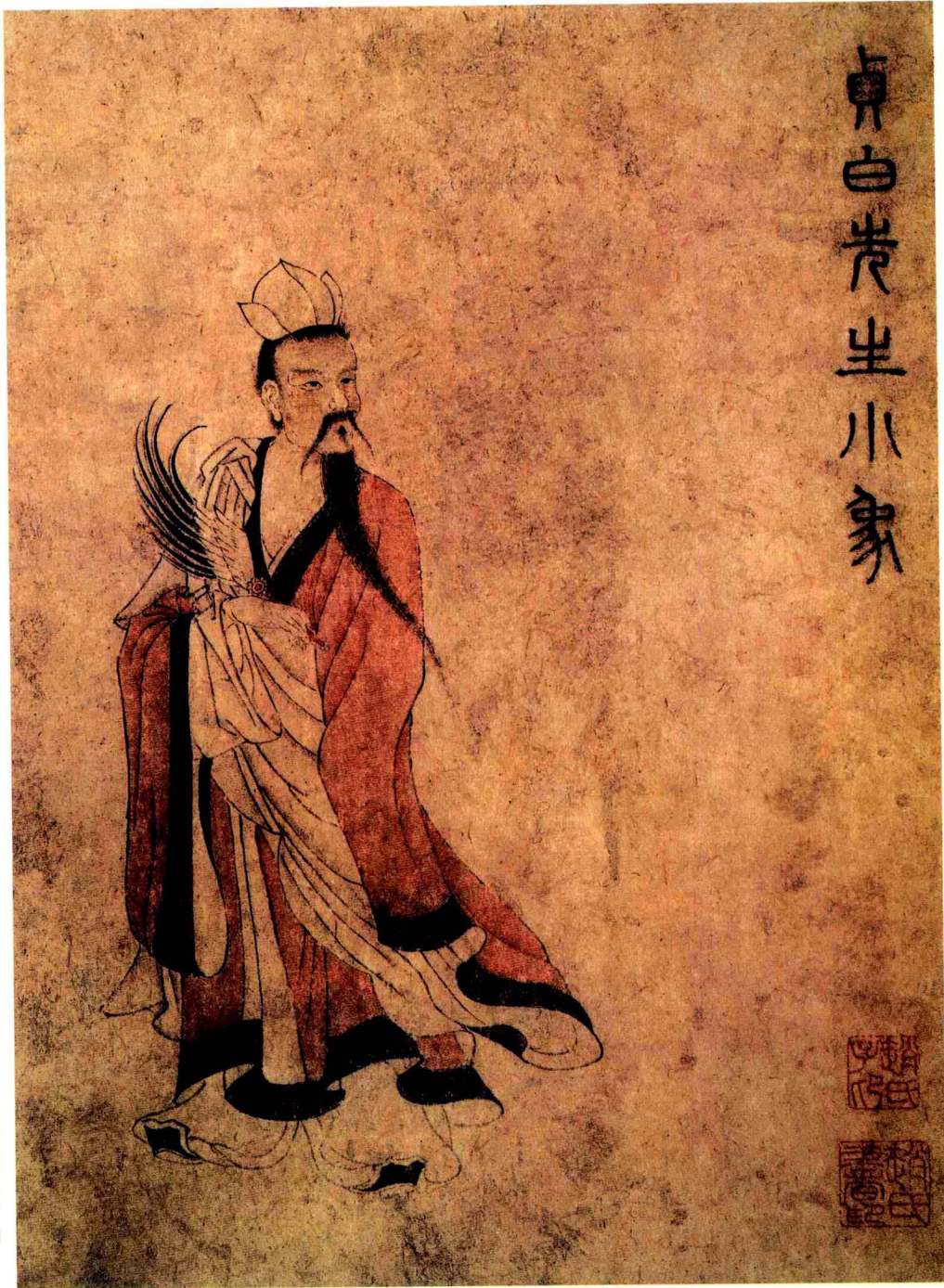
贞白先生之像(赵子昂 元代)

贞白先生：原名陶弘景(456—536)，字通明，自号华阳隐居，谥贞白先生。丹阳秣陵（今南京）人。道教学者，撰《真灵位照图》、《真浩》、《登真隐诀》等重要道书。他整理了道经，并将古代社会的等级制度引入道教神仙信仰体系，排列了包括了天神、地祇及群仙众真在内的庞大的神仙世界，对道教以后的神仙信仰有着重要作用。