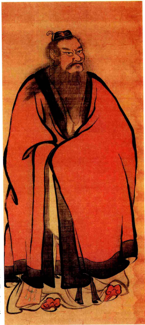
张天师像(樊沂 明代)

张天师即张道陵：(34 - 156)，东汉沛国丰邑(今江苏省丰县)人。五斗米道创立者。原名张陵，字辅汉。汉明帝时任巴郡江州(今重庆市)令，后悟道辞官隐于北邙山(河南省洛阳市北)学长生之道。东汉顺帝(126-144)时携弟子入蜀，创五斗米道，尊老子为教祖，奉《老子五千文》为经典。因后人尊其为张天师，故五斗米道又称天师道。建安二十年(215)，曹操率军攻占汉中，其孙张鲁归顺曹操，迁往北方。天师道成为后世道教的正统道派。元以后天师道与茅山上清派、阁皂山灵宝派等融合统称正一派(或正乙派)。