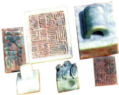
保存在江西省龙虎山天师府中的天师玉印