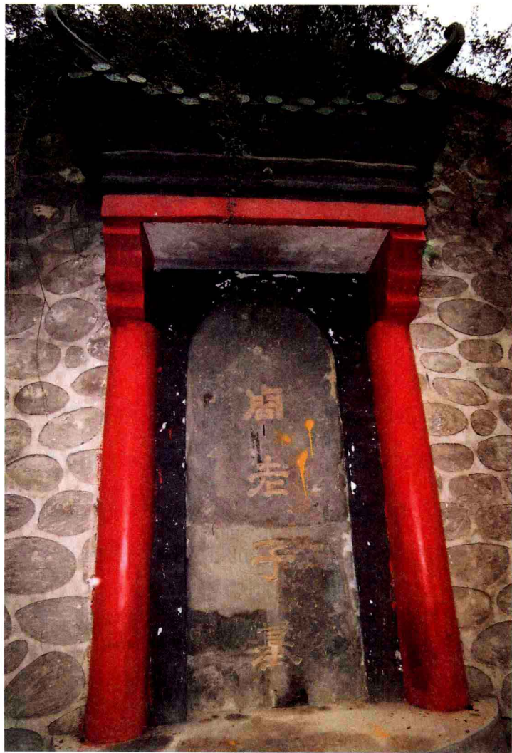
陕西省周至县楼观台大陵山老子墓碑