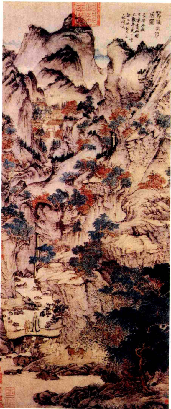
葛稚川移居图(王蒙 元代)

葛洪(203 - 363): 晋时道教学者, 炼丹家, 医学家。字稚川, 号抱朴子, 江苏省丹阳句容人, 著《抱朴子内外篇》, 内篇讲述了神仙之道, 养生延年, 外篇言“人间得失, 世事臧否”, 葛洪肯定了神仙的存在, 神仙可学, 对以后道教炼丹术有很大影响, 对中国古代医学、古代化学也提供了宝贵史料。