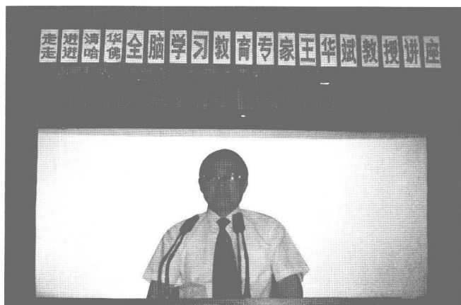
作者在新疆给广 大中学生做全脑 学习讲座。