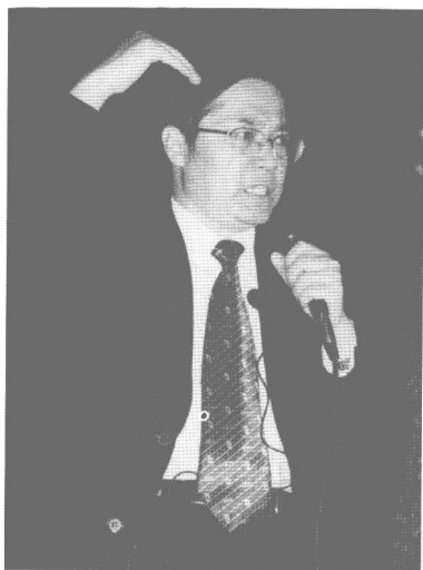
作者在清华大学大礼堂，面对几千名清华学子做全脑学习风暴激情演讲。