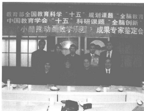
作者参加教育部全国教育科学“十五”规划课题“全脑教育”、中国教育学会“十五”科研课题“全脑创新”成果专家鉴定会。