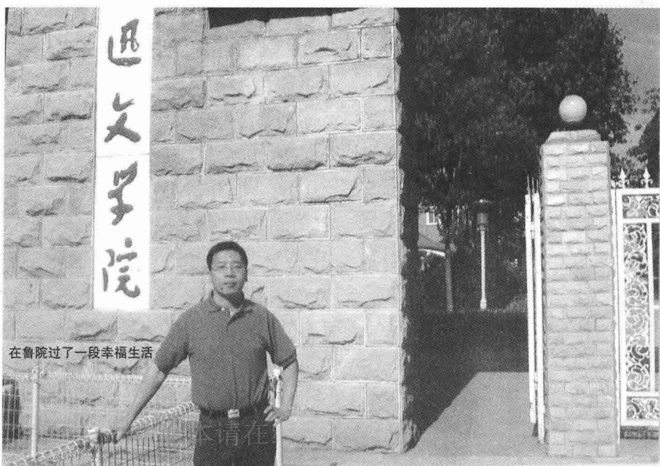
在鲁院过了一段幸福生活