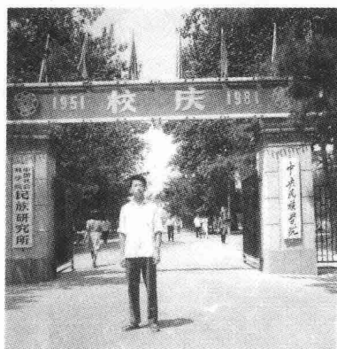
刚入大学时，那是个理想主义的年代