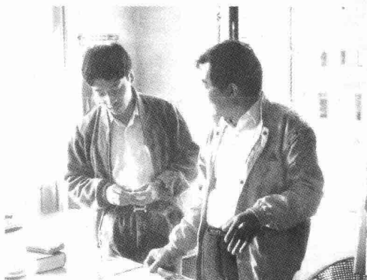
从年轻时候起，我干了15年特殊的涉外工作