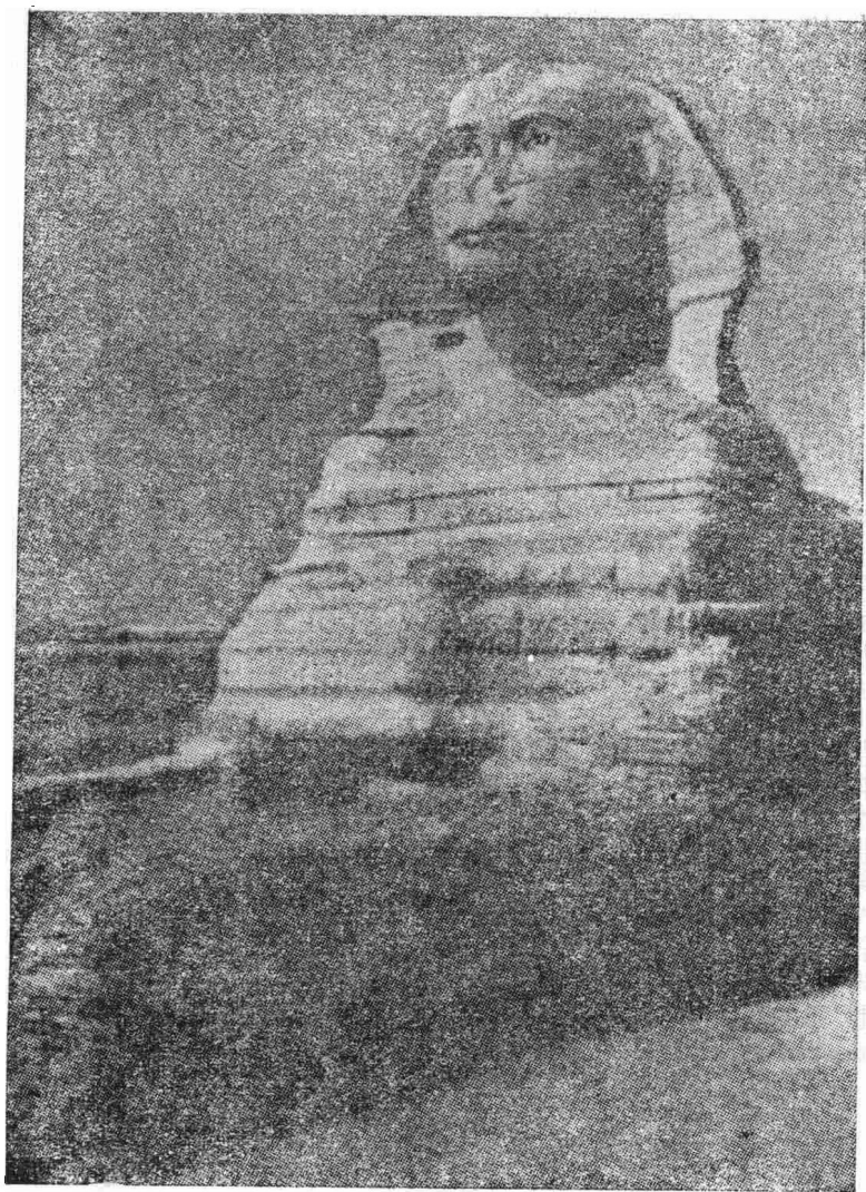
像獸面人身獅的澤基