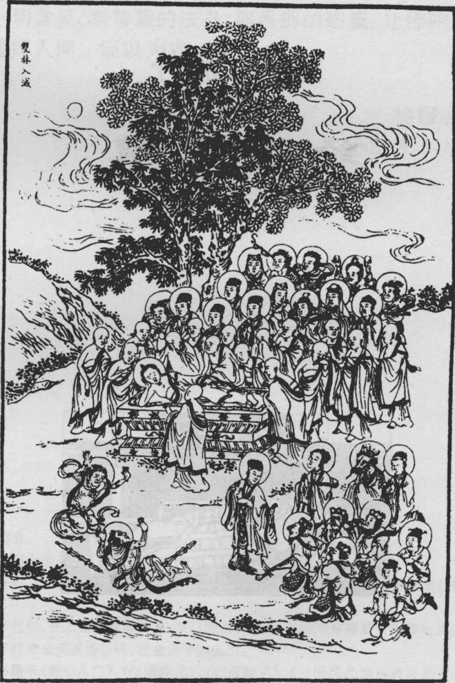
图见清乾隆癸丑年(1793)《释迦如来应化事迹》