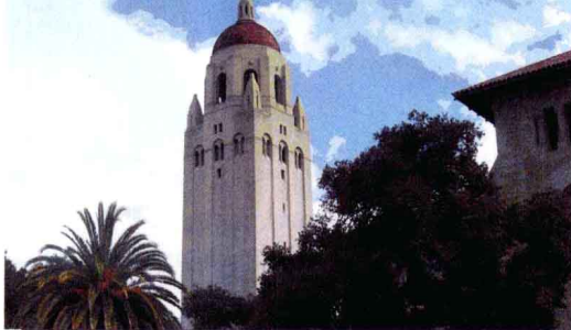
◀ 斯坦福大学校园——标志性建筑胡佛塔典雅庄重