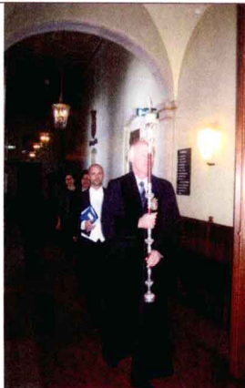
▶ 格罗宁根大学的毕业答辩入场仪式

学目标，就是要实现“美和尊贵之间的统一”。优美整洁的校园环境、精美典雅的建筑和雕塑、繁茂清馨的花草和树木，体现着学校特有的人文风格；校园建筑文化通过优美的环境来熏陶人。大学不但要关注现实，还要着眼长远；不但要为后人留下精神遗产，还要保留住精神遗产的载体——校园。人们不只是听大师的课才能得到思想的升华，行走在校内，就能感受到潜移默化的影响。