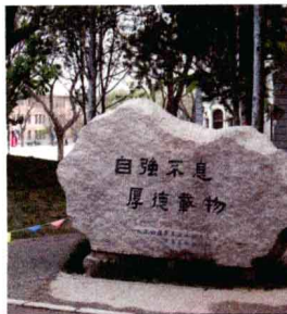
▶ 清华园岩石上刻有校训——自强不息，厚德载物