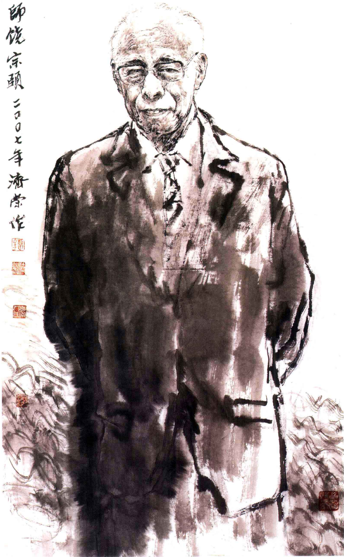
文化大师姚宗颐 196cm × 98cm 刘济荣 作