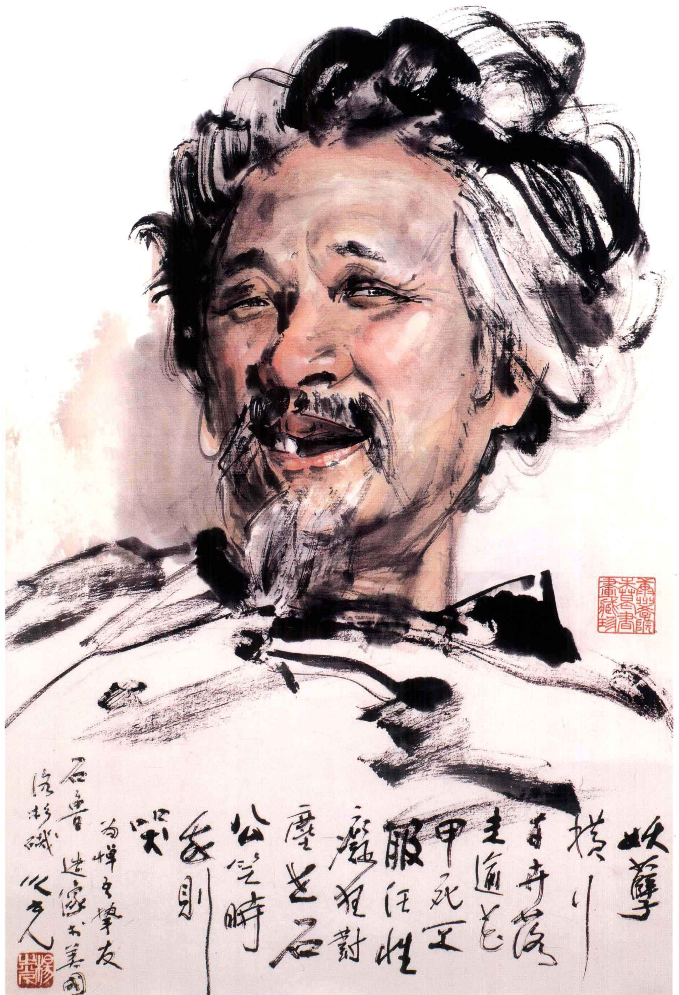
画家石鲁像 69cm × 46cm 1990年 杨之光 作