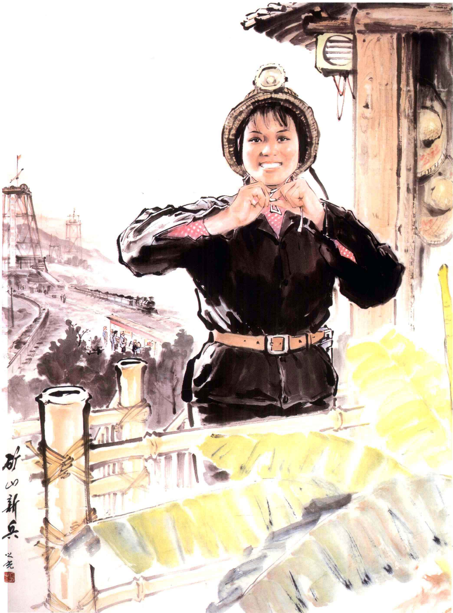
矿山新兵 130cm × 94cm 1971年 杨之光 作