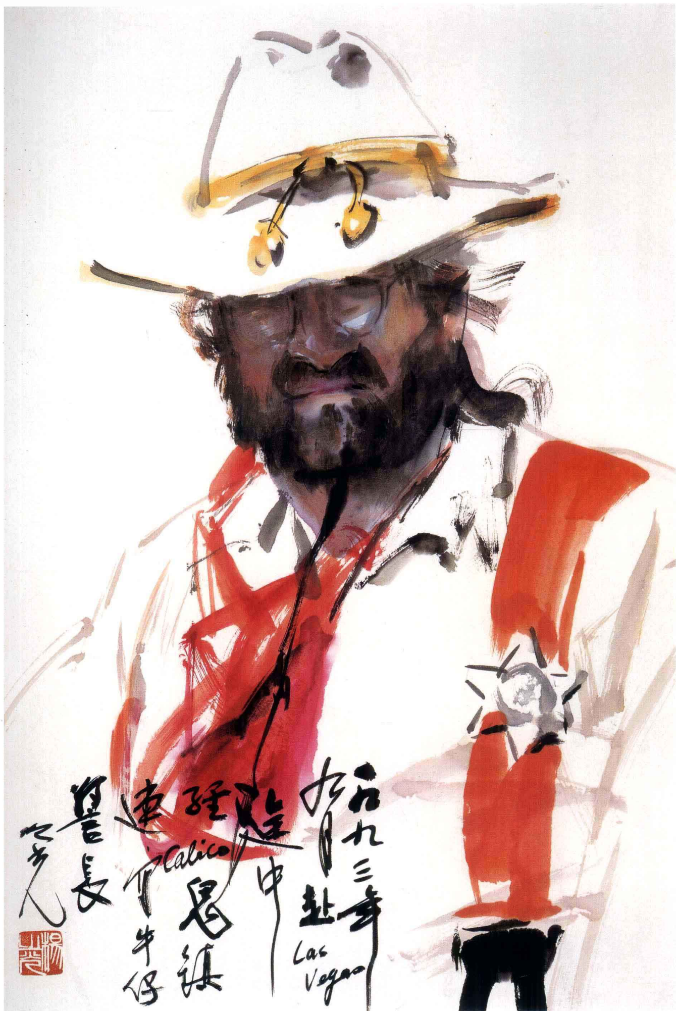
牛仔警长 68cm × 45cm 1993年 杨之光 作