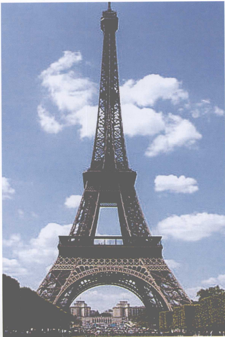
图0-1 法国巴黎埃菲尔铁塔

活活动，如劳作、衣食住行的生产等。它是人类在自然条件和生产关系（社会）条件制约下，为生存而斗争的过程中，也可说是劳动的过程中，对理想的自然现象及理想的社会现象的企望与憧憬，符合自己理想的自然或社会现象，就会感觉美，也可以说美是生活的再现。所以美虽然根源于人类的物质活动，但它属于精神层面，所以具有很深刻的主观性，也决定了它的多变性。精神层面虽然是派生的，但其对物质层面有极大的影响，良好的美育教育，对完善德育、智育、体育的认知有极大的促进。这种理想的自然现象与社会现象包括的范围甚广，有形式方面的，如对称、韵律、统一、对比，也有思想方面的，如依托道德、礼仪、信仰、行为而启发的严肃、自由、崇高、敬畏等。