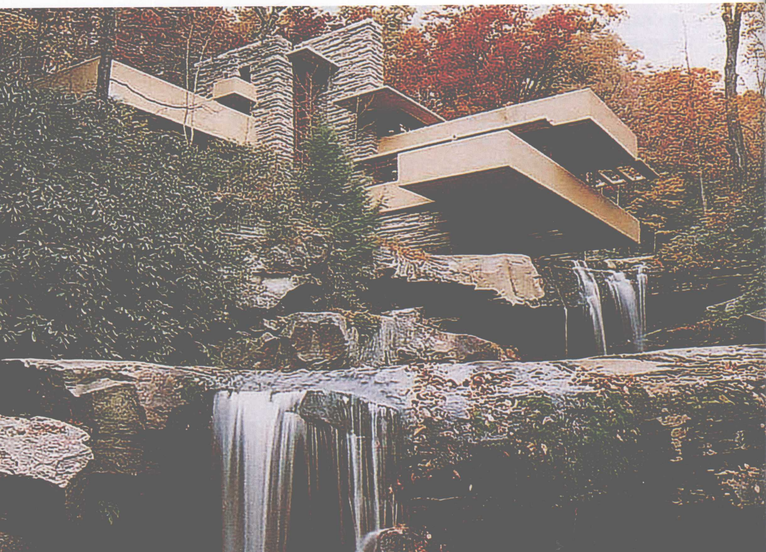
图0-4 美国宾夕法尼亚州考夫曼别墅

谈到建筑美学，应该包括实用的建筑，以及艺术性极高的建筑在内的所有建筑的美学问题。这里有住宅、商店、厂房、办公楼、商店、学校、医院、车站等实用性极高的建筑，也有博物馆、展览馆、大商场、剧院、电影院、体育场等公共性质的对美学要求高的建筑，古代还有些特殊的精神要求的建筑，如宫殿、王府、庄园、寺庙、教堂、园林等，还有纯粹从思想性出发的建筑，如陵墓、佛塔、纪念碑、凯旋门等。在这些纷杂众多的建筑类型中，有实用要求很严的建筑，也有精神要求很高的建筑，无法用统一的标准来衡量。所以有的学者提议把这些建筑按美学要求高低分成若干级，三级或四级，但这仅是一个普通概念而已。例如实用性很高的住宅，在某些建筑师的笔下可做成艺术精品，如美国建筑师赖特在宾夕法尼亚州所设计的考夫曼流水别墅（图0-4）。在北京奥运会期间，谁也没想到一座实用的体育场（鸟巢）会变成轰动全世界的明星建筑，不仅成为北京的标识，还成为一个旅游项目（图0-5）。所以建筑类型分级，无法厘定建筑实用与艺术