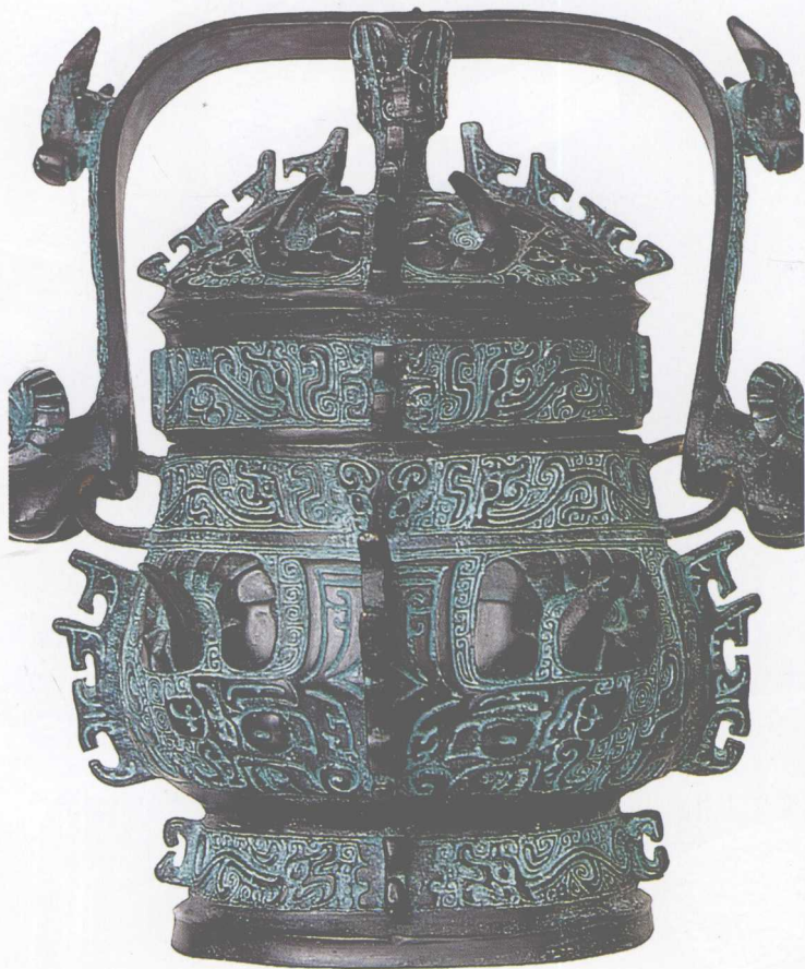
图 0-3 商周青铜器上的饕餮纹饰