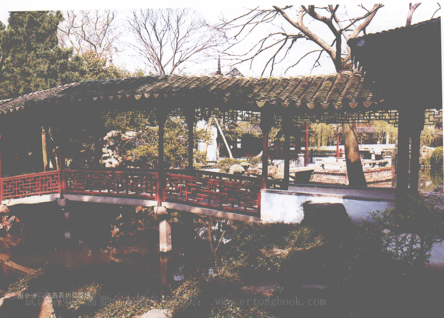
图 0-8 江苏苏州拙政园