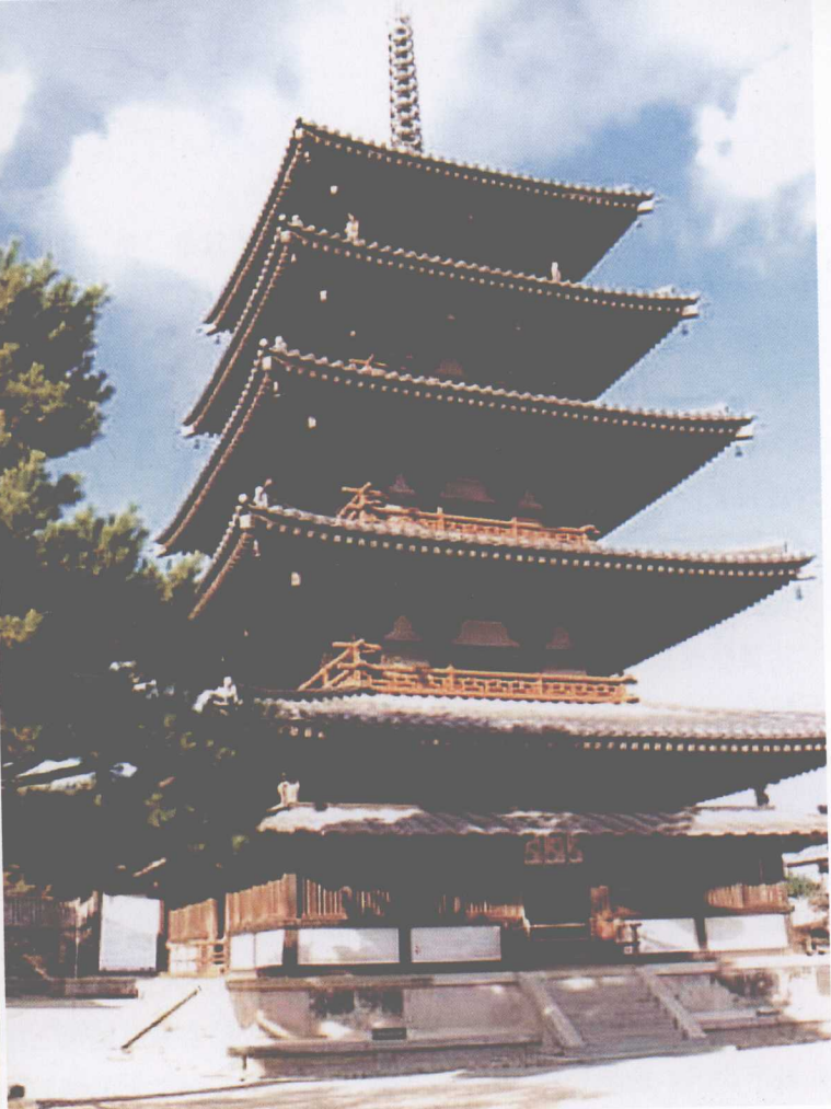
图 0-7 日本奈良法隆寺五重塔（受唐代建筑影响）