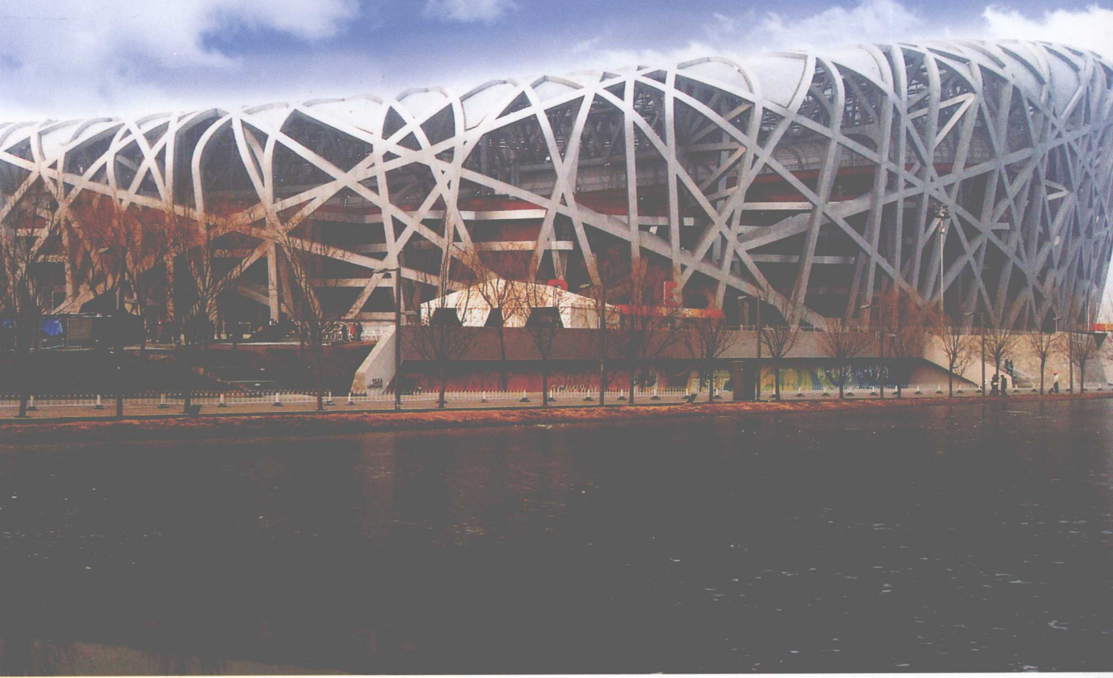
图 0-5 北京奥运体育场

之间的关系。但总的来说大部分建筑是实用性建筑，具有一定的美学要求。故在建筑理论中叙说建筑构成的三要素为“实用、经济、美观”，或“实用、坚固、美观”，皆提出了美观的要求。而按精神要求创作的独立的艺术作品的建筑是少数，它们并不按“三原则”的要求去创作，但就是这些少数建筑揭示了建筑美学的重大成就。过去学者书写建筑发展史所引用的实例，大部分是艺术性较高的建筑，建筑史故也可称为建筑艺术史。