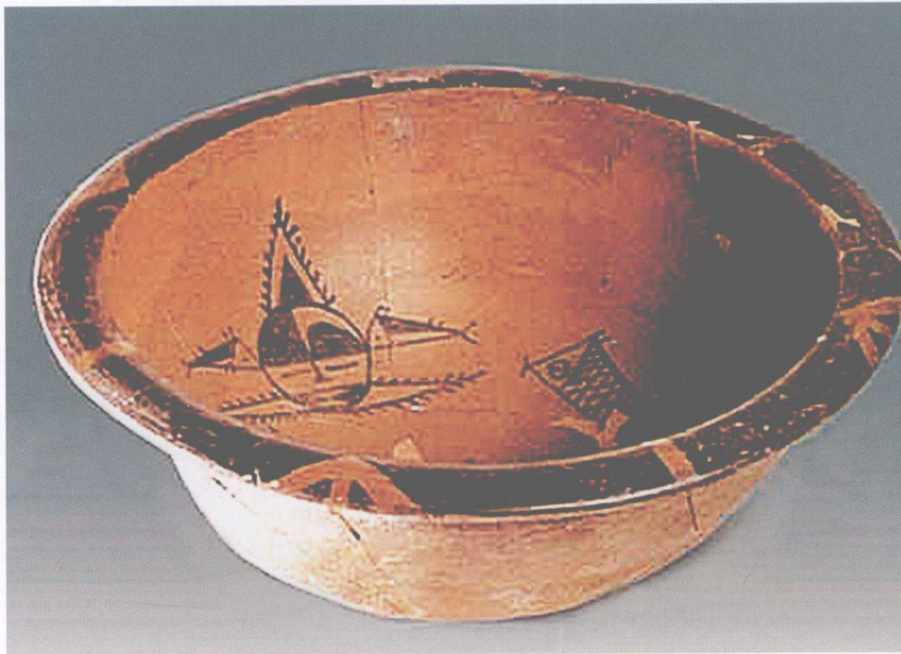
图 0-2 原始彩陶上的鱼纹饰

从美学角度看当前人类获得艺术创作的范畴是相当广泛的。一般可分为五大门类：即实用艺术——建筑、工艺美术，以至于服装、家具、器具等；造