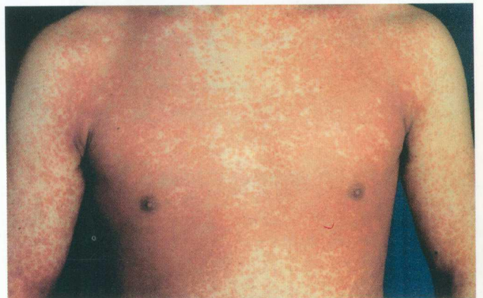
彩图 4 药物性皮炎