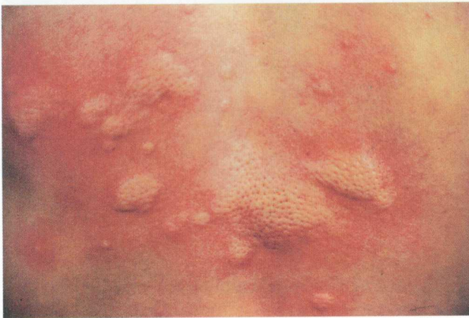
彩图 3 荨麻疹