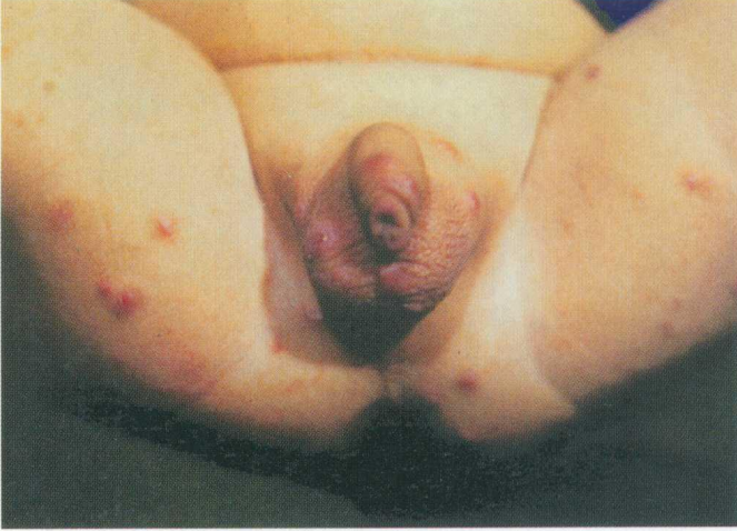
彩图 13 疥疮