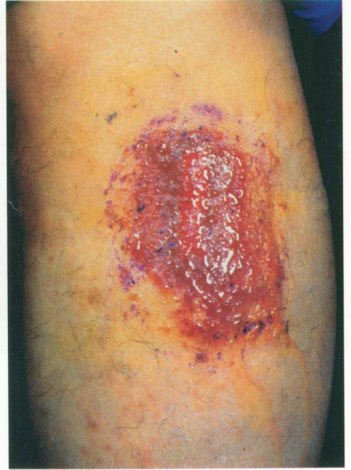
彩图 2 湿疹