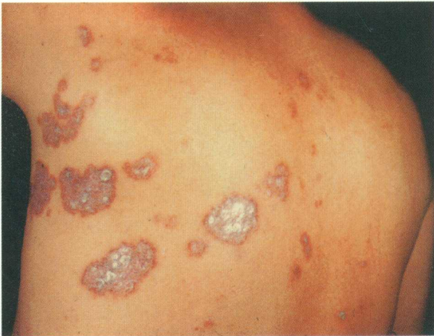
彩图 15 寻常型银屑病