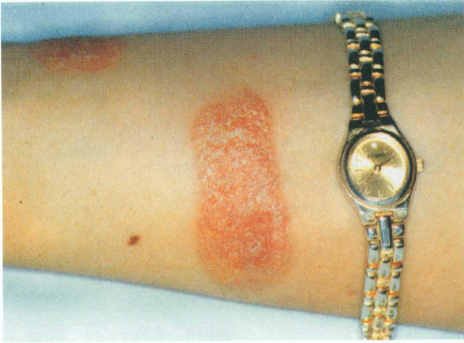
彩图 1 变态反应性接触性皮炎