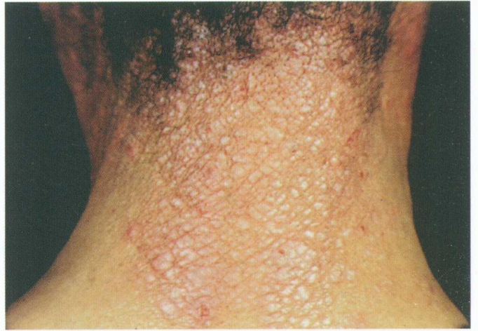
彩图 14 慢性单纯性苔癣