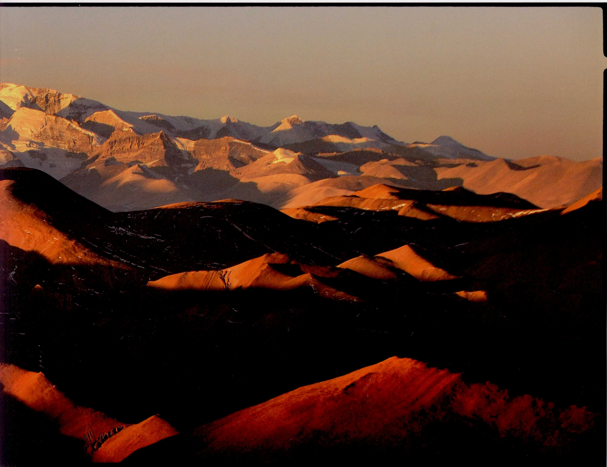
ཉིམ་ལཡའི་རི་རྒྱུད། 喜马拉雅山脉 Himalayas