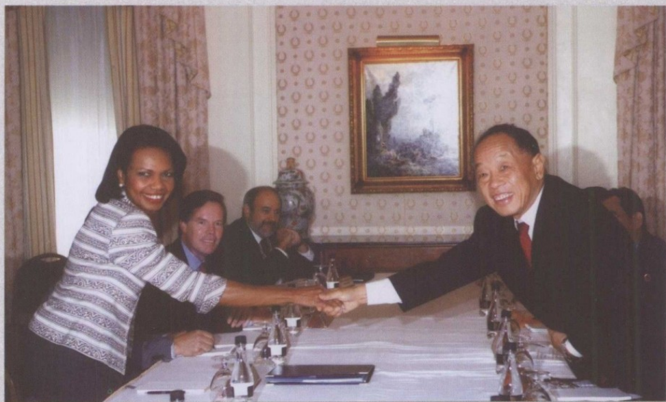
2005年，与美国国务卿赖斯会谈