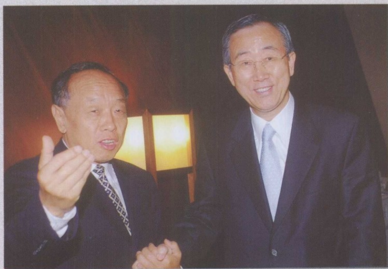
2007年，和 联合国潘基文秘 书长会晤