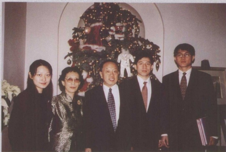
2000年12月，和妻子、儿子、侄子、侄女在白宫过圣诞节