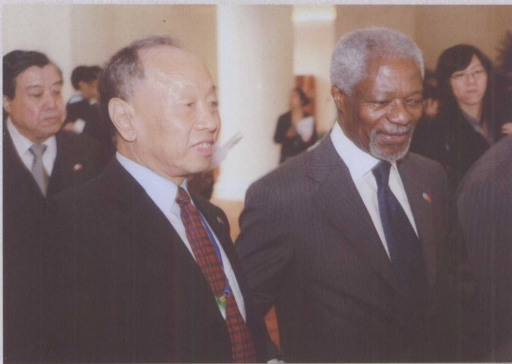
与前联合国秘书长安南在一起，后排左一为外交学会会长杨文昌