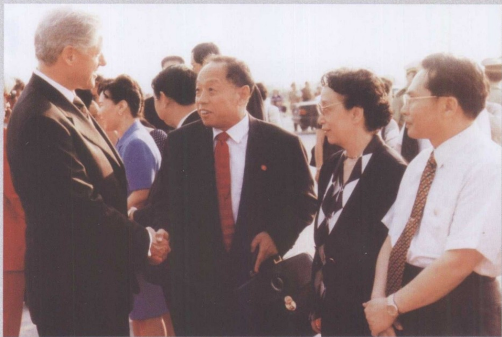
1998年，接待克林顿总统夫妇访问西安