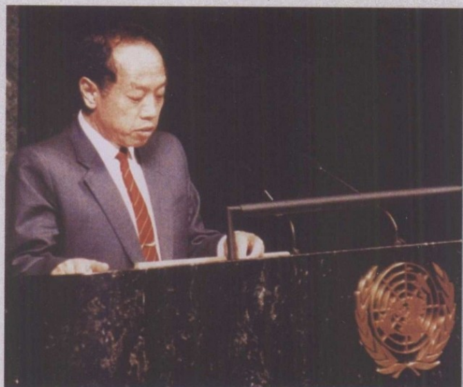
1994年7月28日，代表中国政府在联合国大会上发言