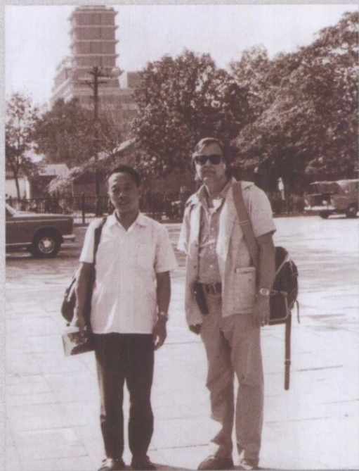
1979年，陪同美国记者在中国参观采访