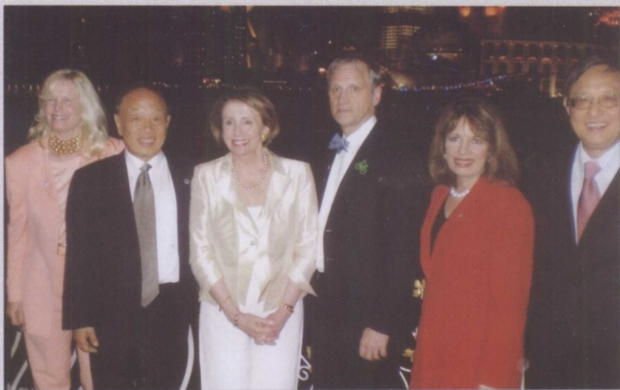
与时任美国众议长佩洛西在一起，右一为时任驻美大使周文重