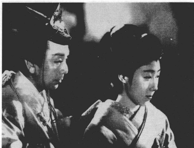
1944年，在战争末期，沟口健二拍摄了古装武打历史片《名刀美女》。