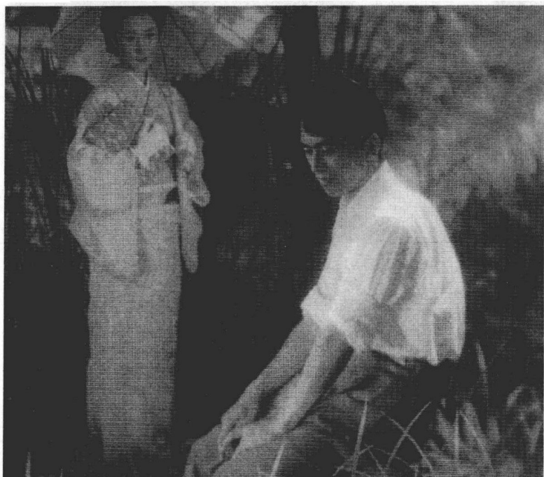
| 1951年拍摄的《武藏野夫人》在影像上极富日本绘画的格调。