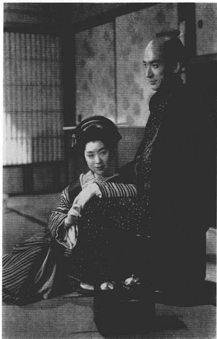
拍摄于1946年的影片《歌麿周围的五妇女》，把江户时代风俗画大师歌麿的生活经历搬上了银幕。