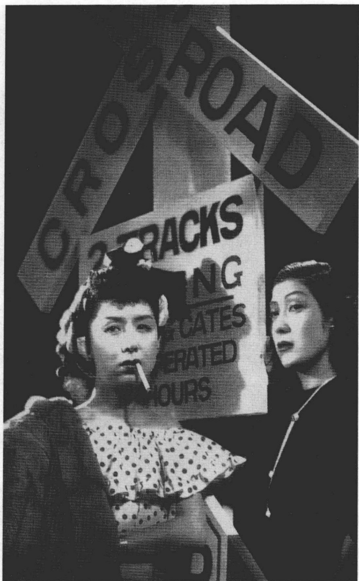
| 1947年拍摄的《夜晚的女人们》是沟口健二关注社会问题的一部杰作。