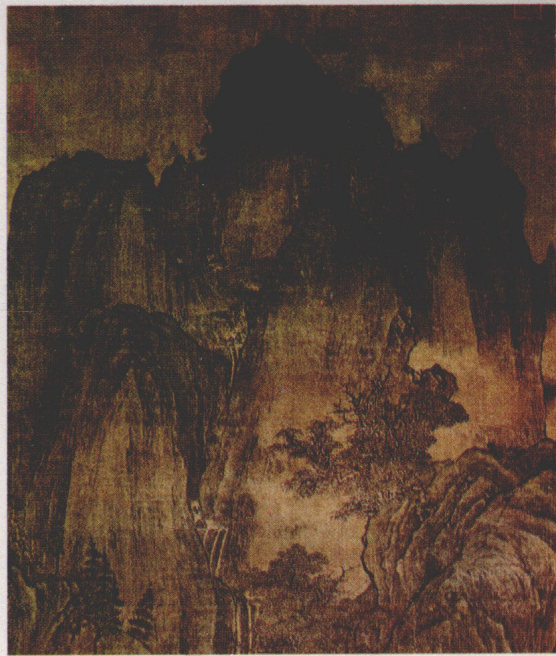
▲（后梁）关全《秋山晚翠》

朱温杀戮的对象既包括敌人，也包括自己的兵将。他以十分严苛的手段管理军队。若将领在战斗中阵亡，其部属须与之一同赴死；若胆敢退回，则一概处死。因此将领阵亡后，兵卒只能逃跑。朱温还在兵卒的面部刺字，假如他们逃跑，被捉住了就只有一死。