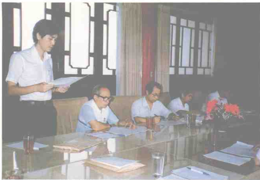
何為起左，議會席聯行舉人筆執及人持主科學各組科學文語國 (攝鳳琴黃)。員委彰慶林、順國古、祐兆劉、炳慶葉、彭寄