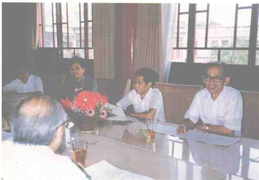
錦黃起右，議會席聯行舉人筆執及人持主科學各組科學文語國。員委讚洪、熊威李、濟宗羅、鉉