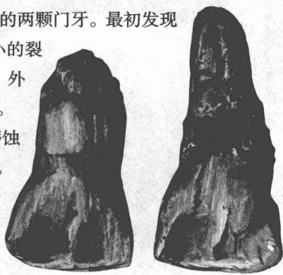
元谋人门齿化石 据考证，元谋人的这两颗牙齿，一为左上内侧门齿，一为右上内侧门齿，同属于一个成年个体，可能是一个青年男性的。

把这些牙齿化石同“北京人”牙齿化石比较后，就会发现它们也呈铲形，具有很大的相似性；同时，“元谋人”的牙齿同纤细种南猿的牙齿也有几分类似。这一方面反映了“元谋人”同纤细种南猿间的传承关系，也反映了其同“北京人”之间的亲缘关系。