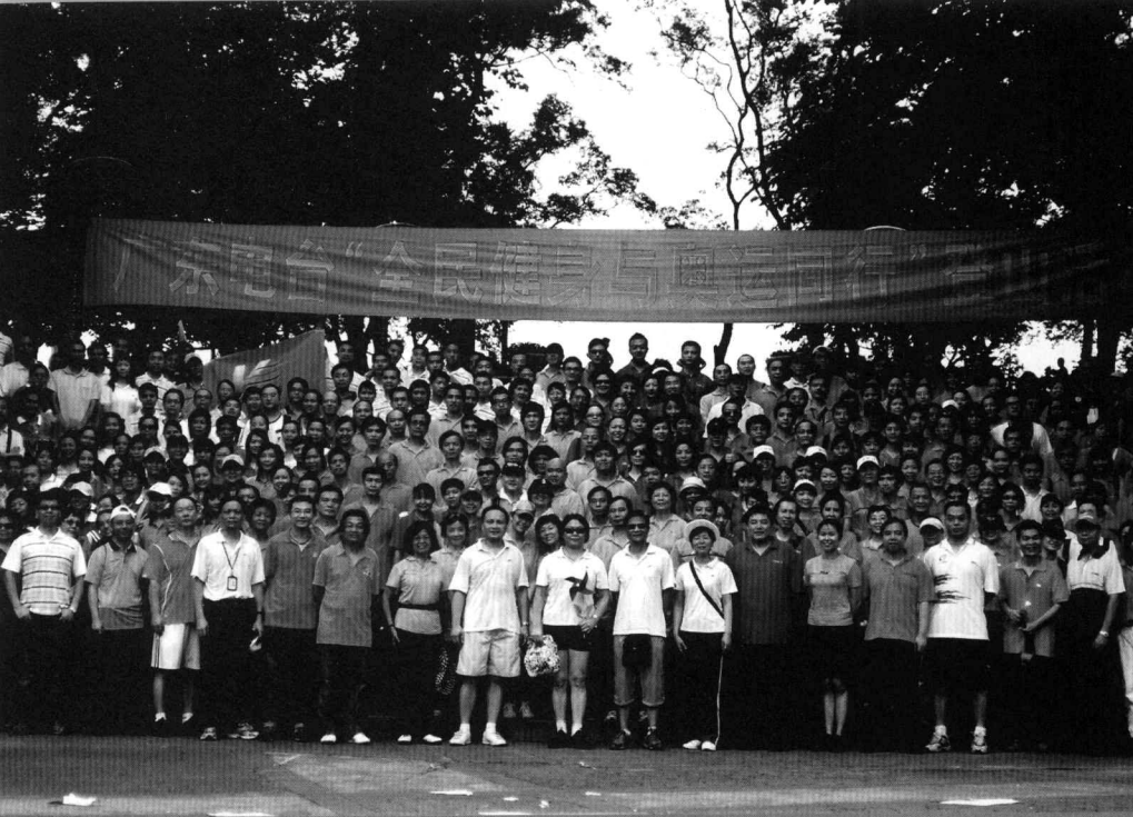
2007年6月20日广东电台员工登广州白云山活