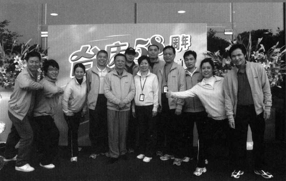
2007年11月27日广东电台58周年台庆运动会