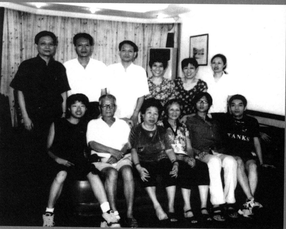
三代同堂,天伦之乐。