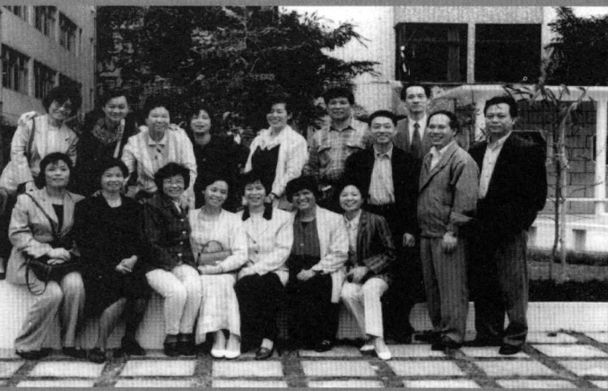
1997 年 11 月广州 医学院毕业 20 周 年同学聚会