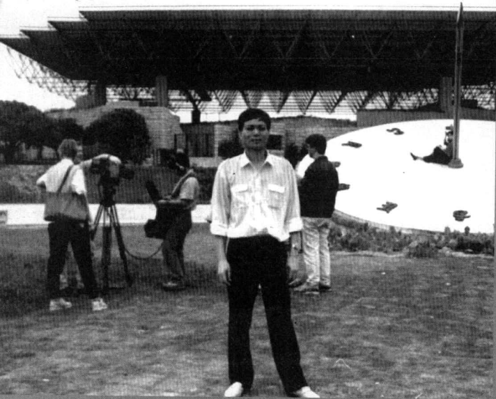
1989 年接待美国 摄制组