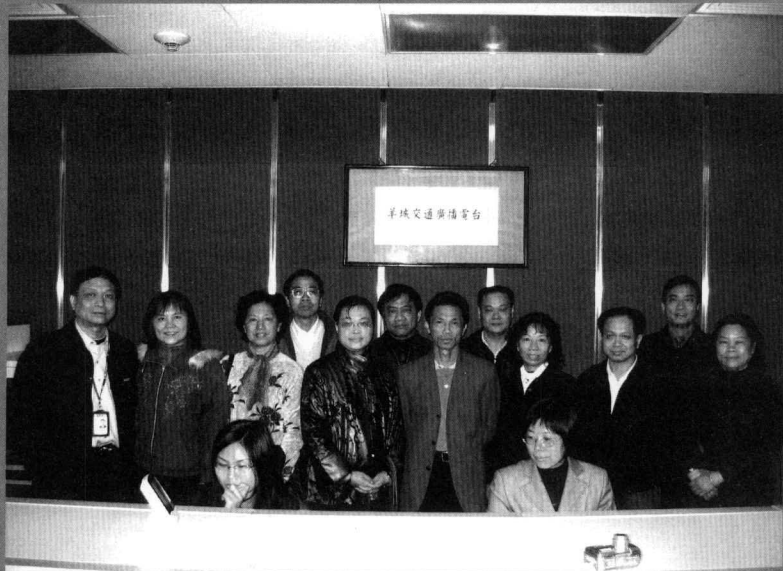
2007年3月 部分中学同学 参观电台