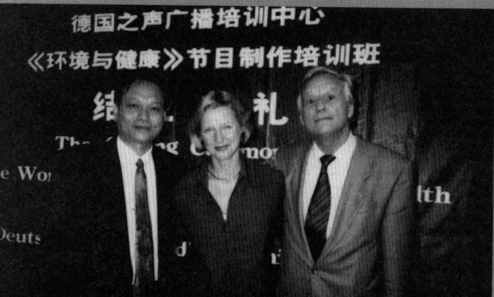
1996 年接待德国 之声外宾