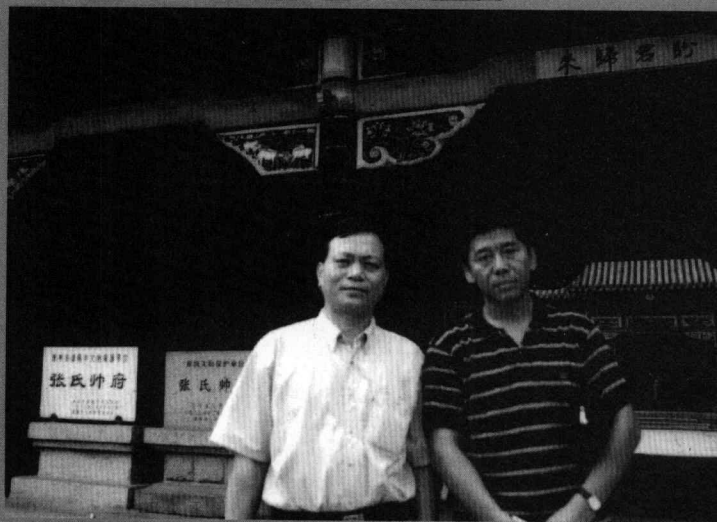
1996年7月赴 沈阳参观张氏 师府