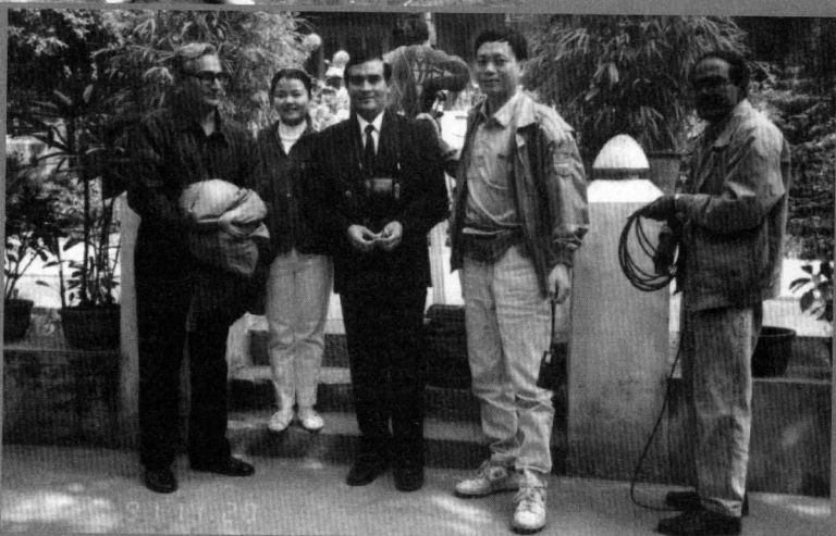
1991 年接待 印度摄制组