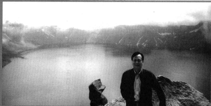
1996年参观 吉林长白山 天池