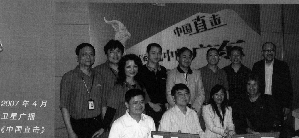
2007年4月 卫星广播 《中国直击》