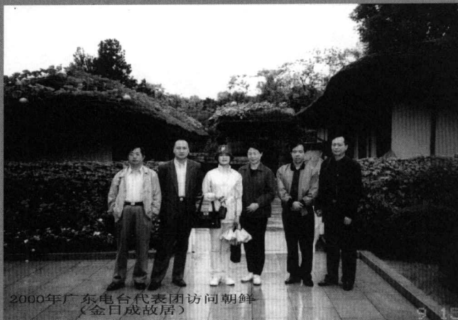
2000年广东电台代表团访问朝鲜 (金日成故居)