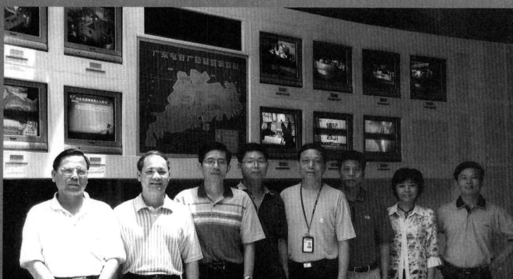
2007年5月 部分研究生班 同学参观电台