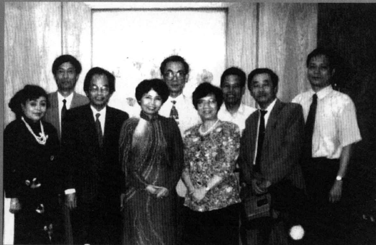
1997年接待越南之声外宾