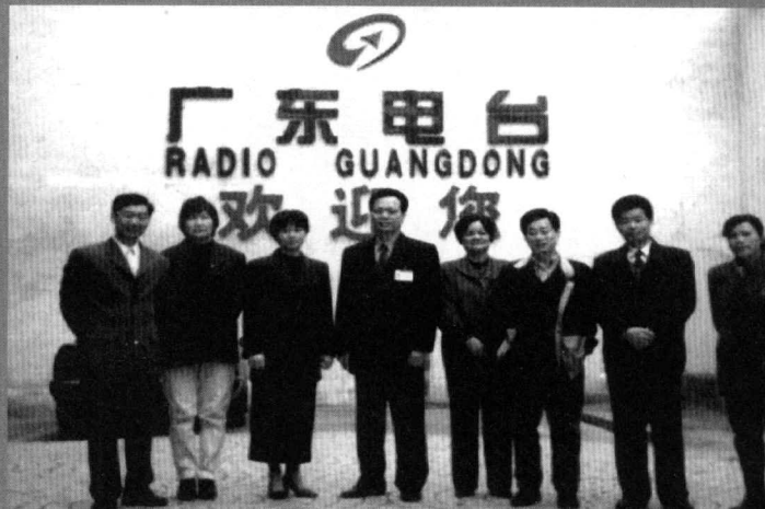
1999 年部分同学 参观电台