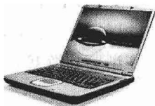
(c) 体积更小的便携笔记本电脑