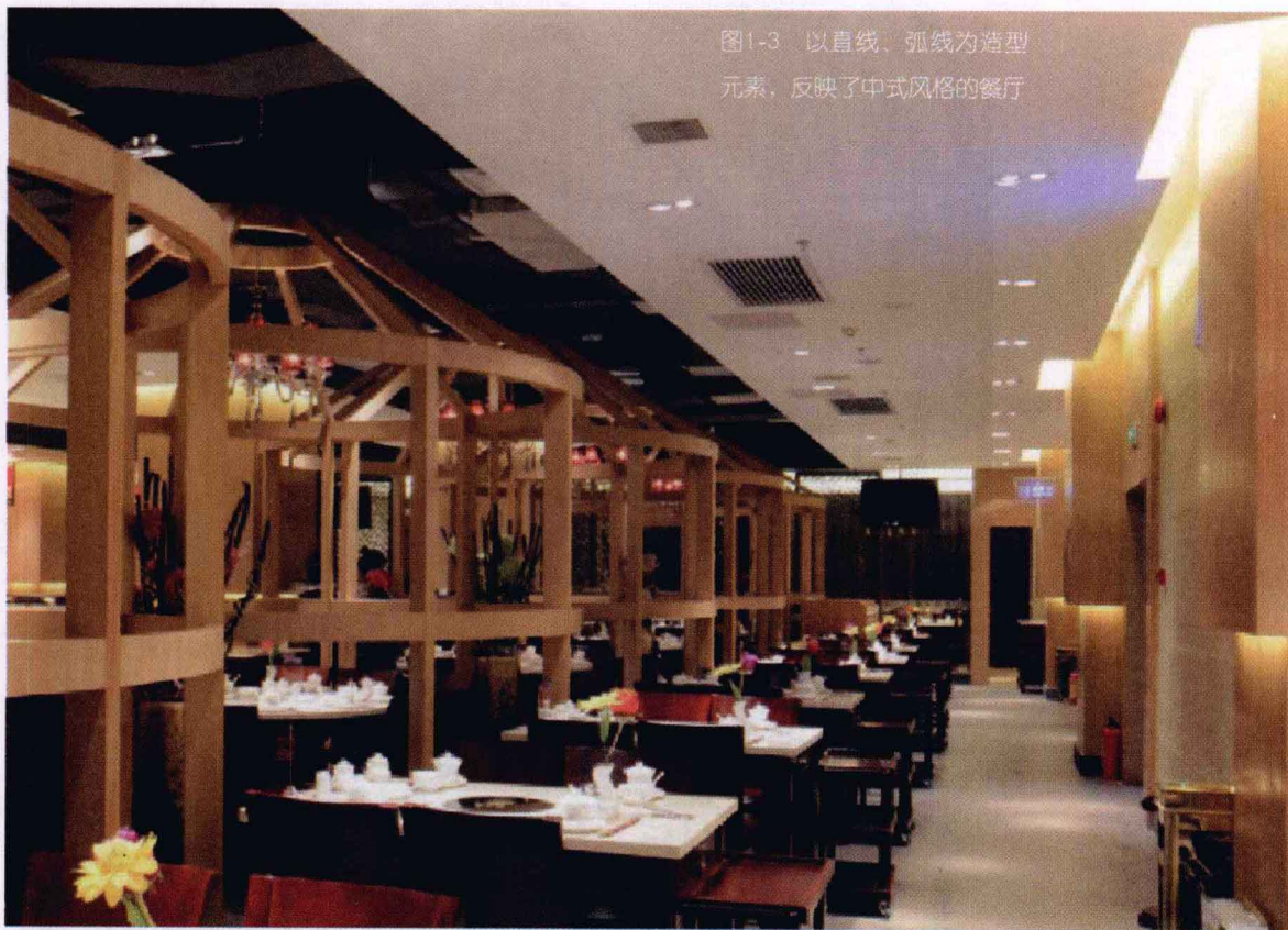
图1-3 以直线、弧线为造型元素，反映了中式风格的餐厅

传统风格的公共空间设计，是在室内布置、线形、色调以及家具、陈设的造型等方面，吸取传统装饰“形”、“神”的特征。例如吸取我国传统木构架建筑室内的藻井天棚、挂落、雀替的构成和装饰，明、清家具的造型和款式特征。又如西方传统风格中的仿罗马风、哥特式、文艺复兴式、巴洛克、洛可可、古典主义等，其中又如仿欧洲英国维多利亚式或法国路易式的室内装潢和家具款式。此外，还有日本传统风格（和风）、印度传统风格、伊斯兰传统风格、北非城堡风格等。传统风格常给人们以历史延续和地域文脉的感受，它使室内环境突出了民族文化渊源的形象特征（如图1-3至图1-5所示）。