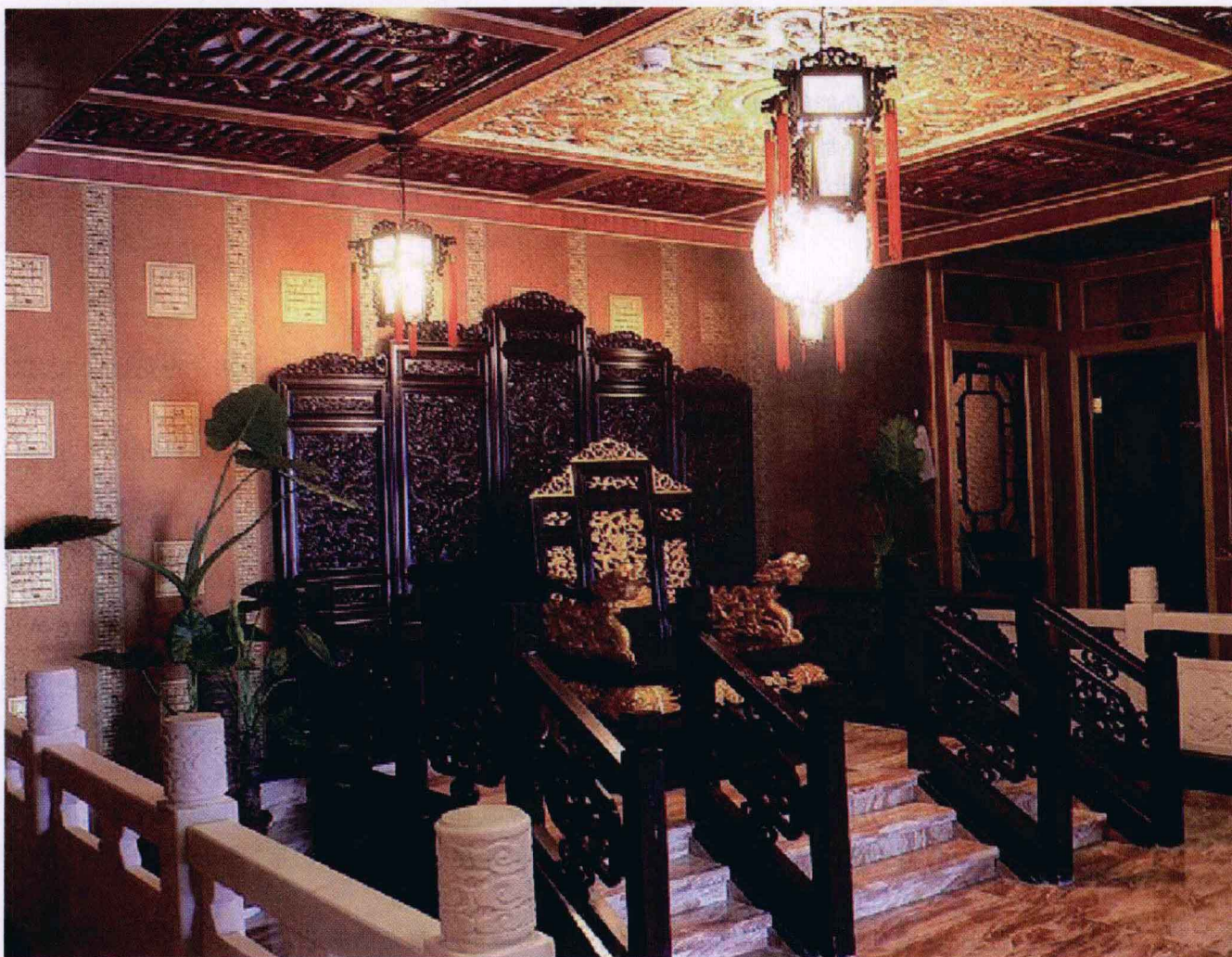
图1-1 以线为主要造型元素，雕梁画栋的装饰性设计，反映了中国传统文化室内设计特点