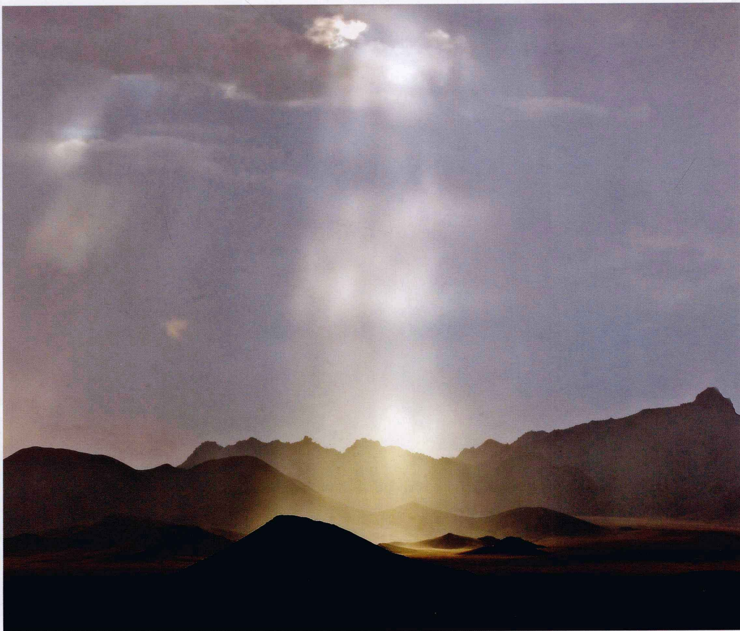
一束阳光洒落大地 | 克莱夫·阿尔登霍芬 (拍摄细节见P154)