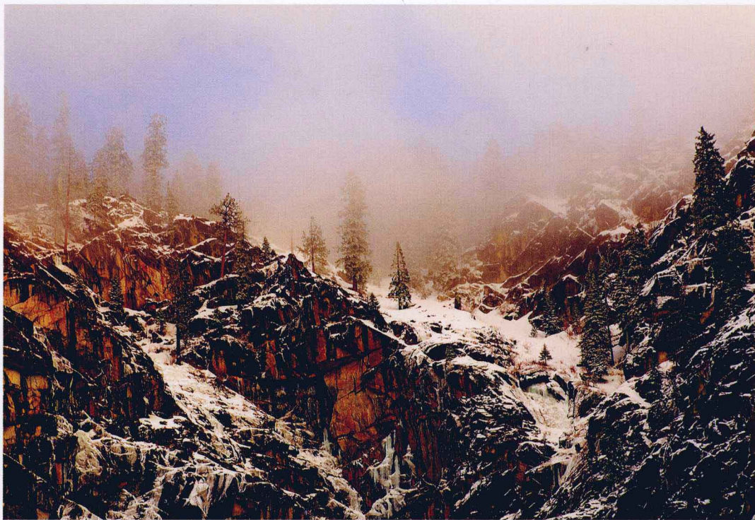
遥望约塞米蒂国家公园 | 布莱恩·克拉克 (拍摄细节见P154)