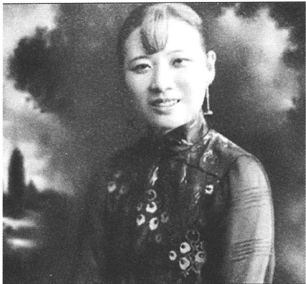
少女时代的宋美龄

蒋宋二人第一次见面是在1922年12月初，宋子文在孙中山位于上海莫里哀路的寓所主持了一个社区基督教晚会，蒋介石受邀参加。宴会在二姐的家里举行，又是大哥主持，宋美龄的出场就顺理成章了。经宋庆龄的介绍，蒋介石在晚会上认识了这位貌美的女子。那天宋美龄穿一件白色晚礼服，身材苗条、气质非凡，在同与会